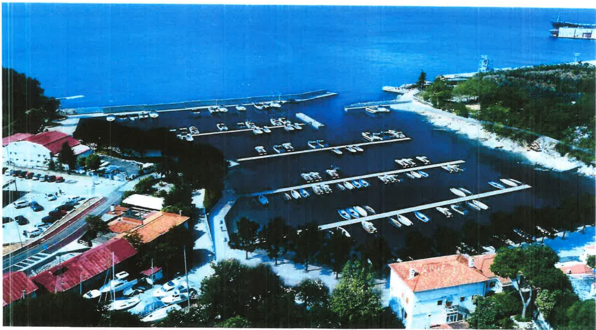
3D prikaz - pogled sa sjeveroistoka