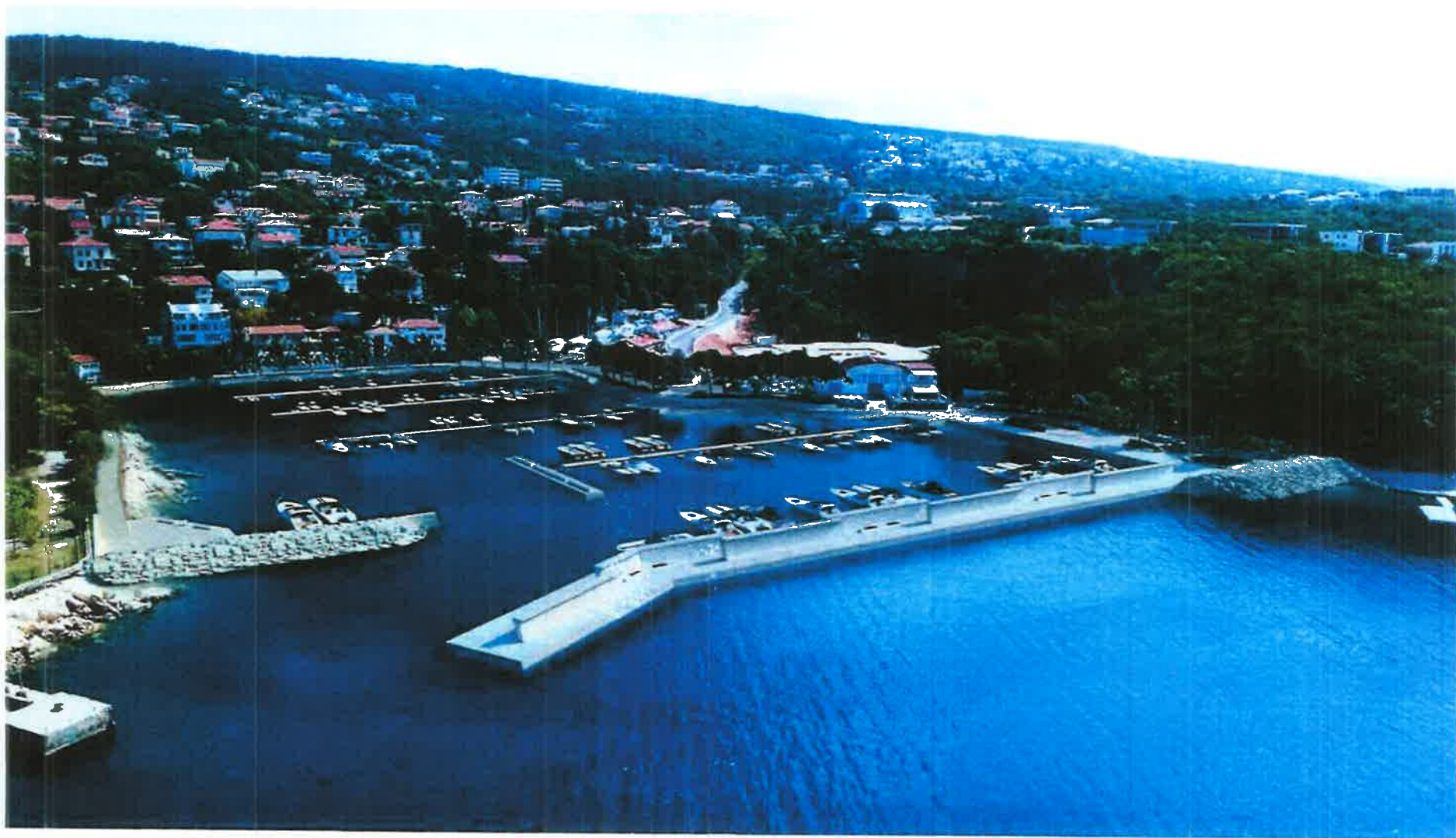
3D prikaz - pogled sa jugozapada