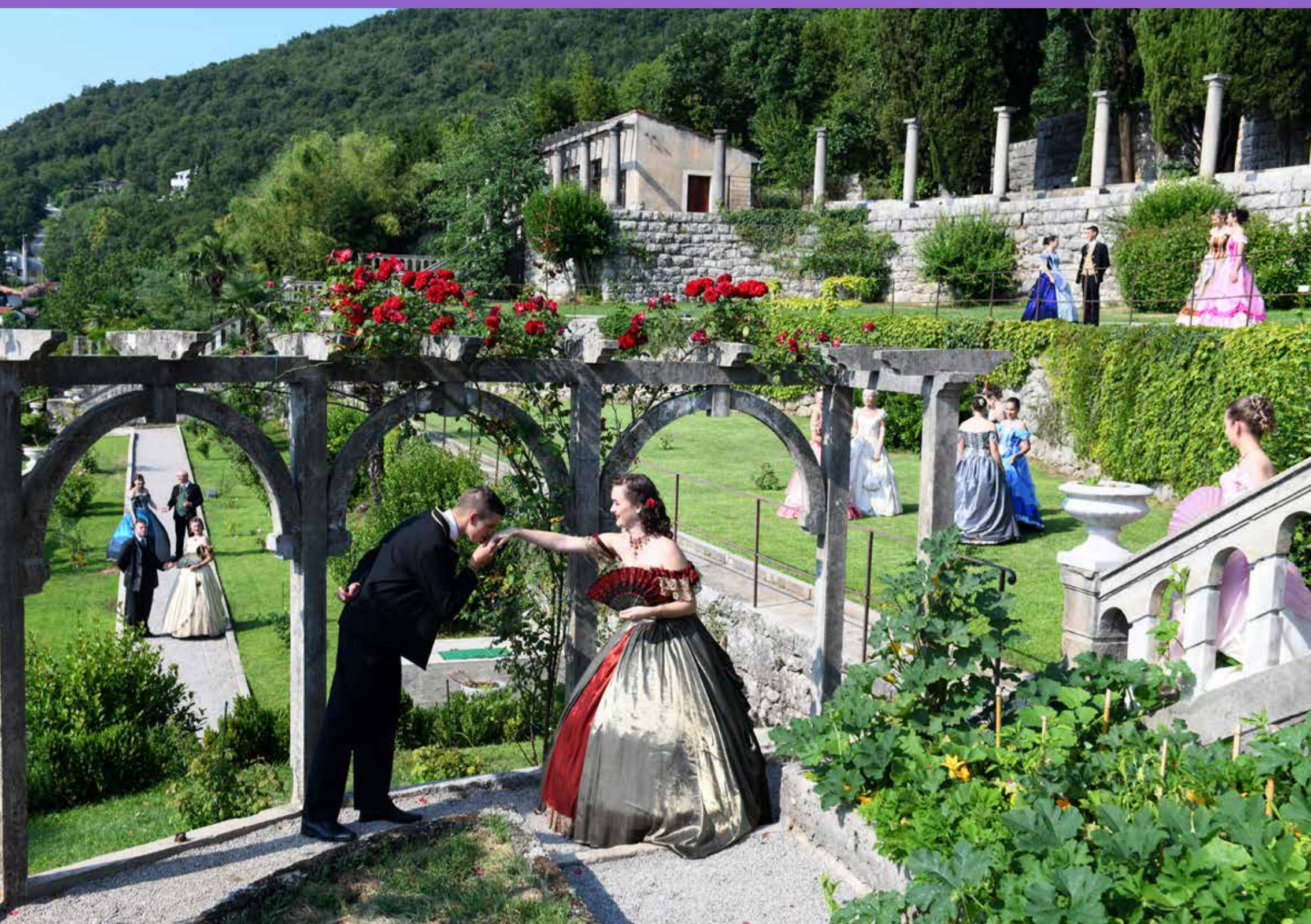
(članovi Udruge Potkalnički plemenitaši iz Gornje rijeke)