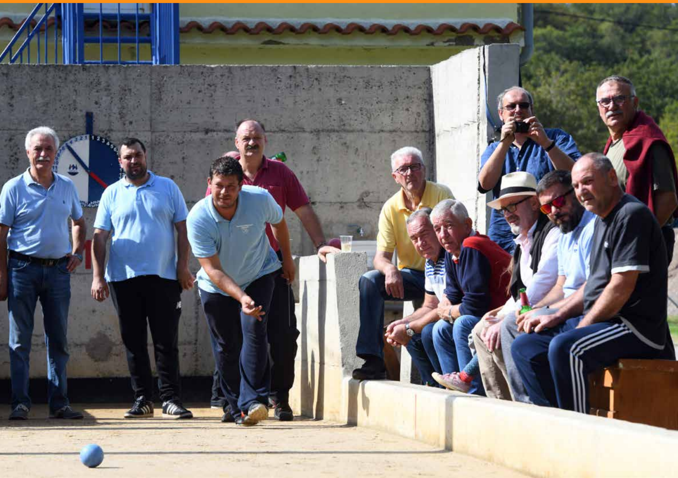
(jog u Hroljevu i članovi Društva sportske rekreacije Krasica)