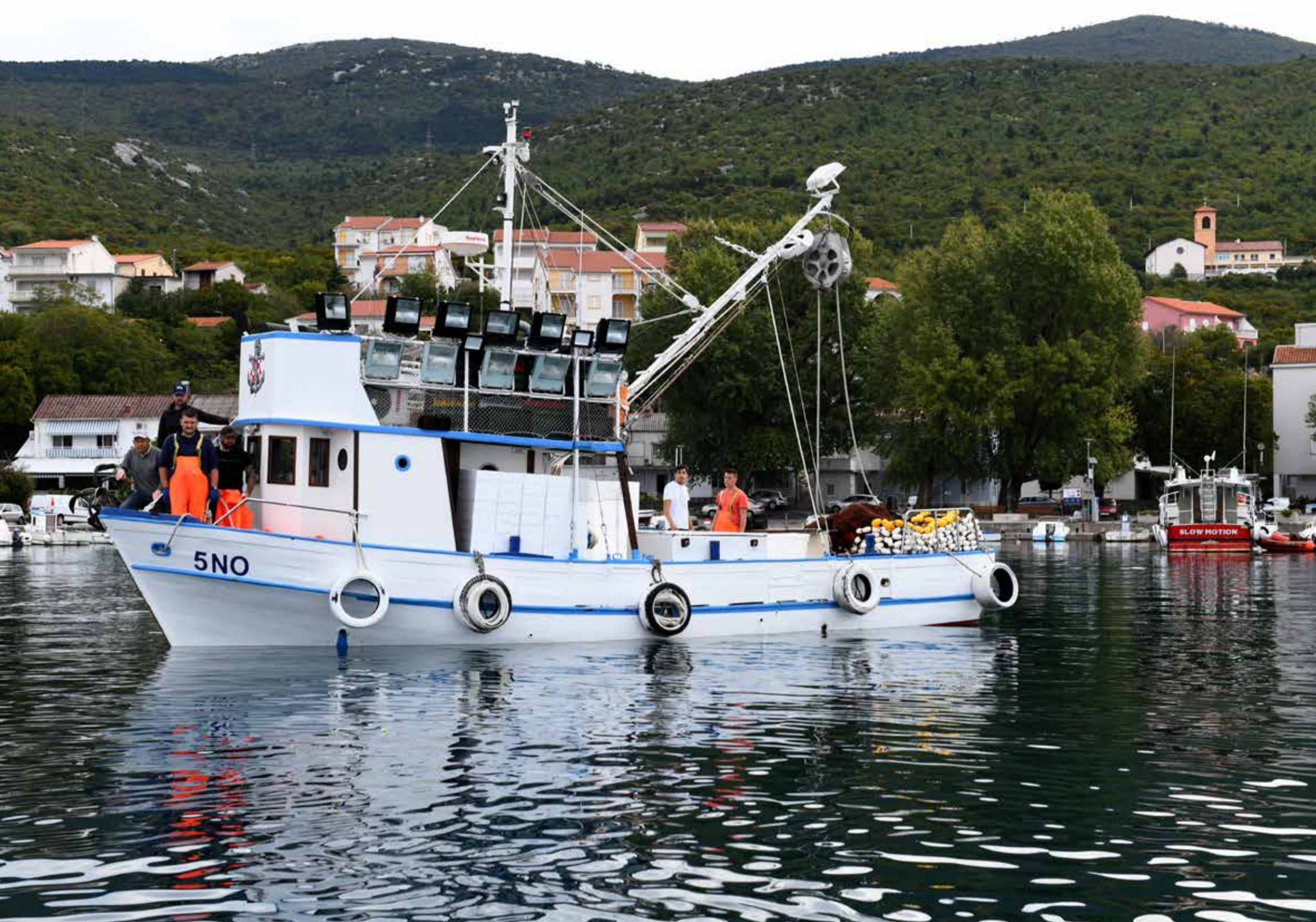
(posada broda "Sipar" pri povratku s ribarenja)