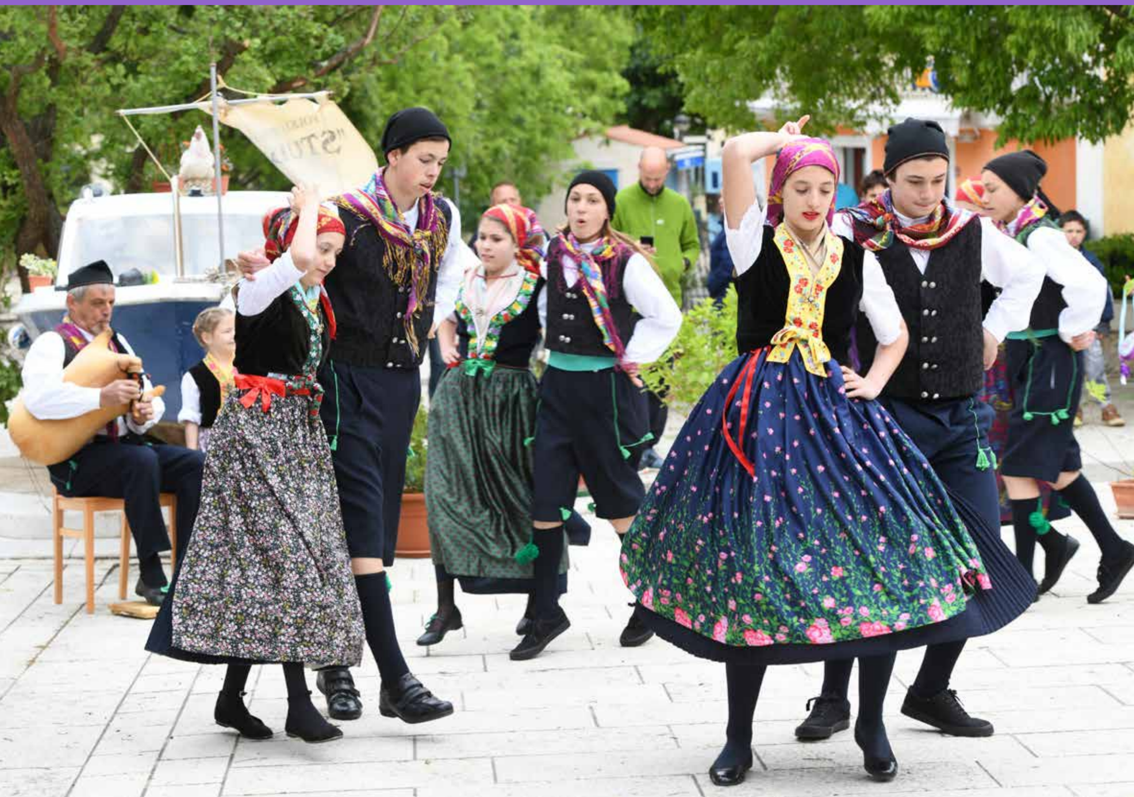
(Članovi Folklornog društva Studenac iz Nerezina)