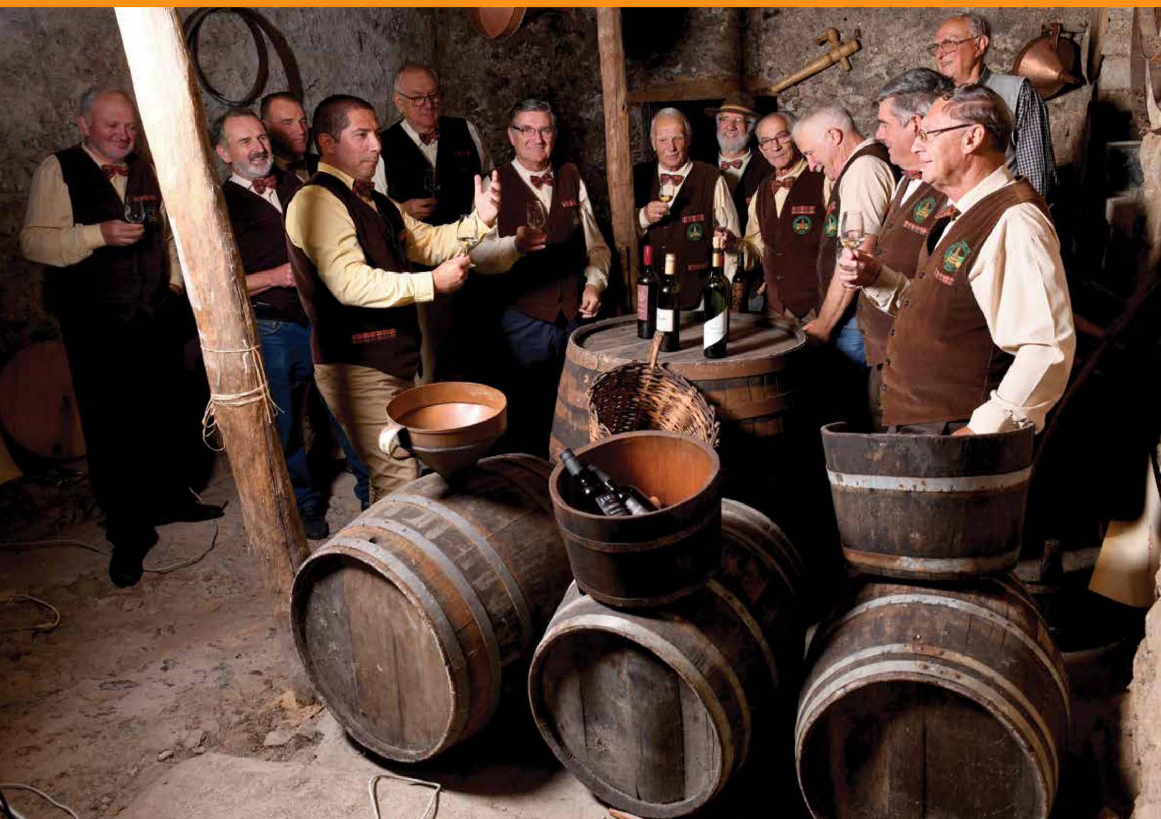
(članovi kastavske Udruge prijatelja ruž, grozja i vina Belica)