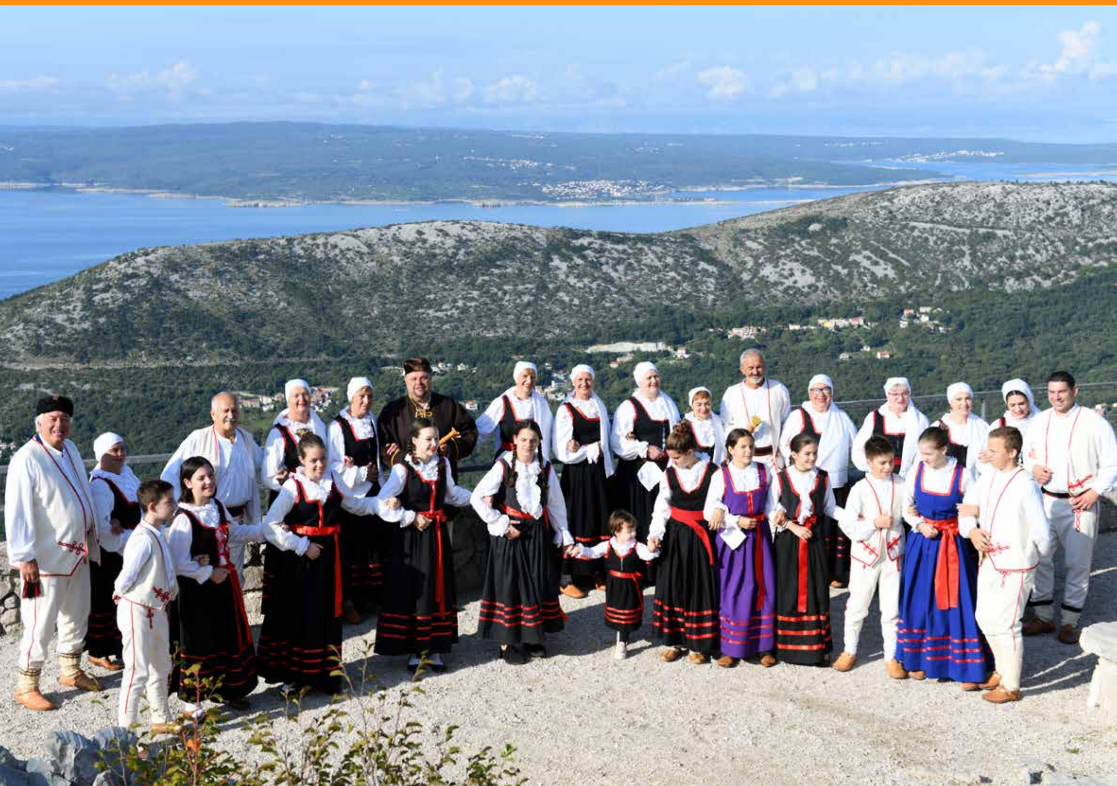
(vidikovac Slipica i članovi KUD-a Bribir)