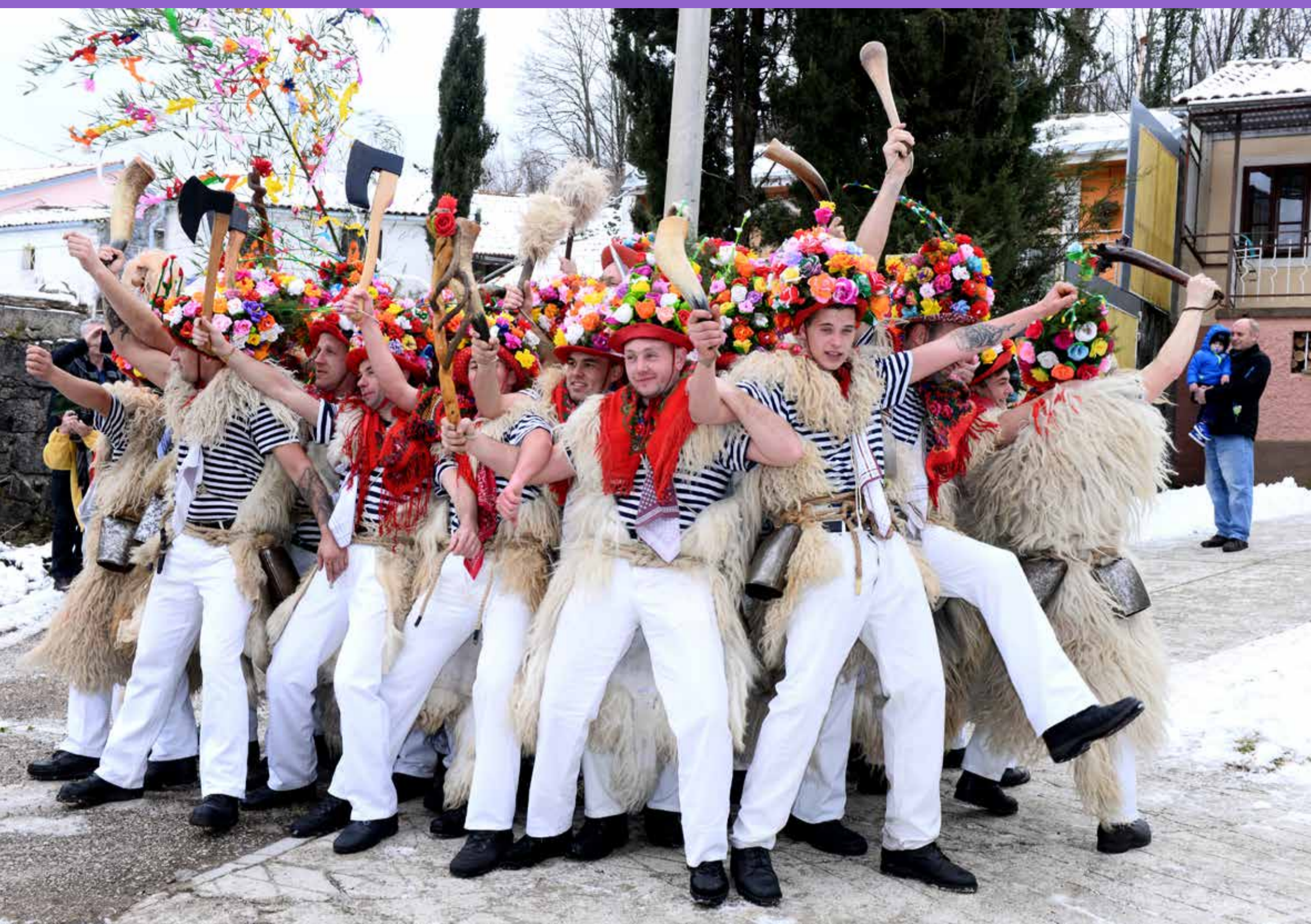
(Rukavački zvončari za jednog od tradicionalnih ophoda na Zvoneću)