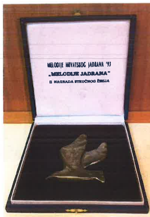
Melodije hrvatskog Jadrana 2. nagrada žirija