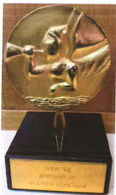
nagrada za aranžman Split 1993