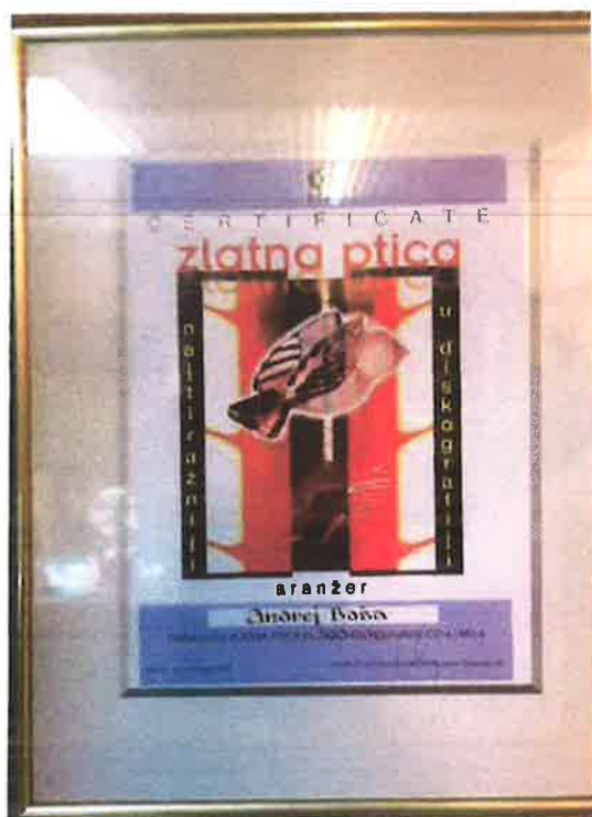
Zlatna ptica Croatia Recordsa za aranžmane 263.000 prodanih ploča od 1982 - 1992