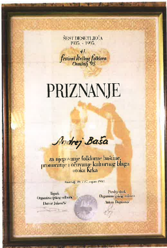
Priznanje za njegovanje folklorne baštine otoka Krka Festival krčkog folkloru 95'