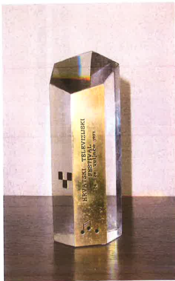
Hrvatski televizijski festival 1. nagrada