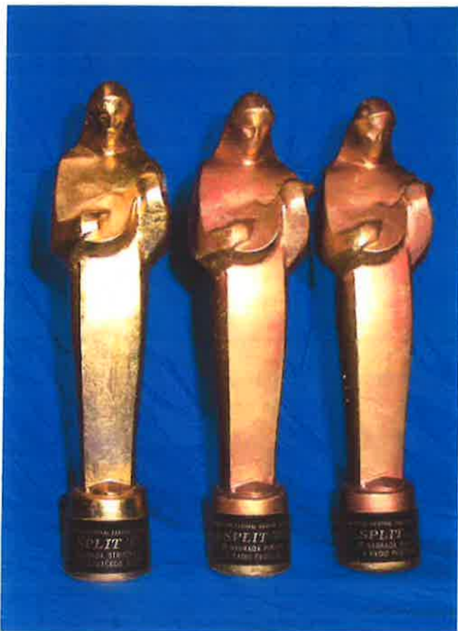
TROSTRUKA POBJEDA "SPLIT 95"