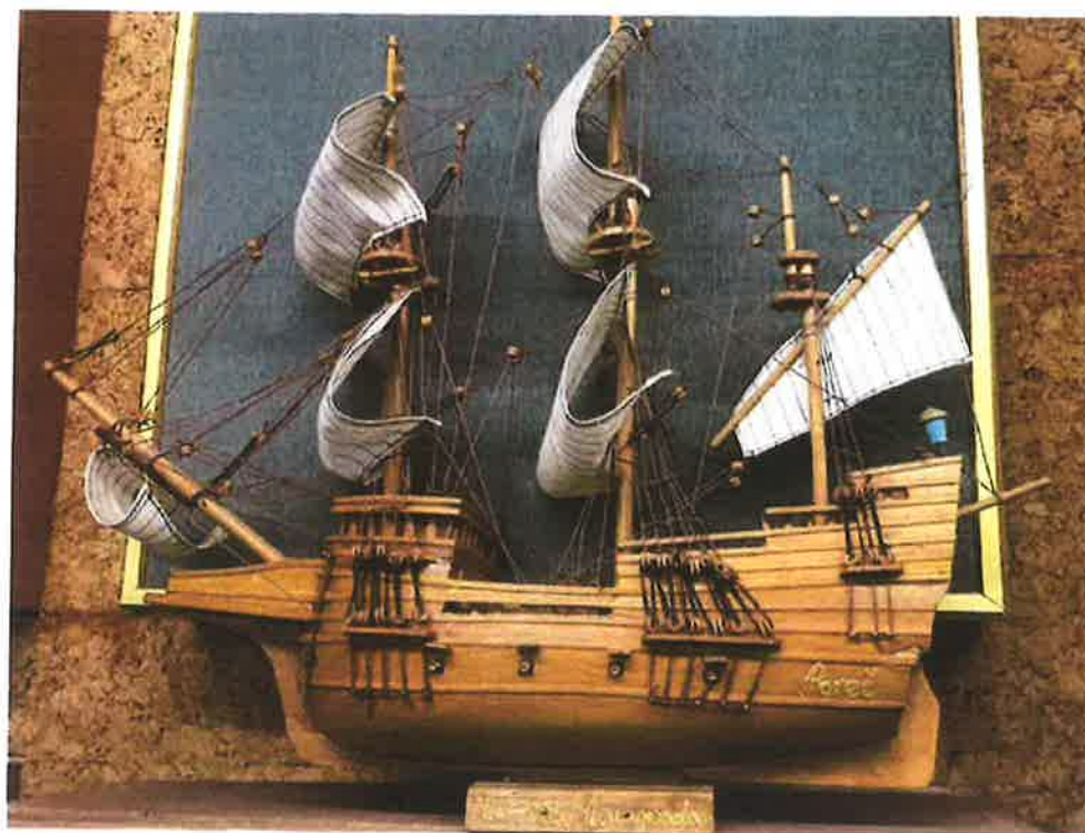
1. nagrada publike MIK 2003