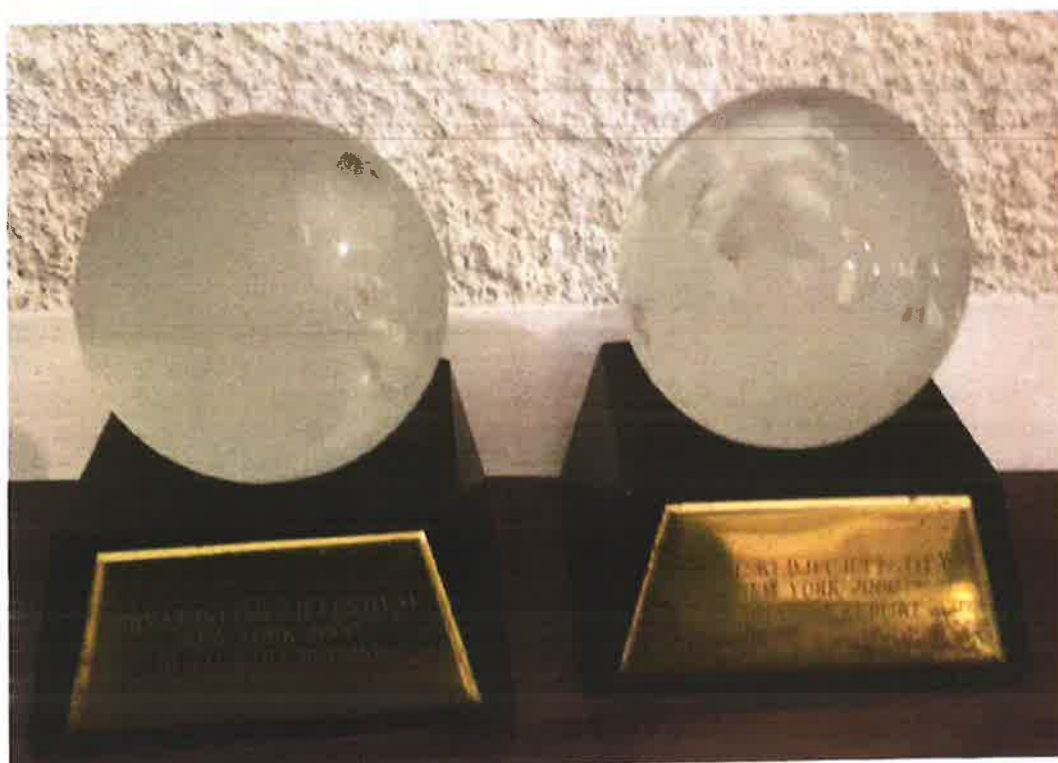
Hrvatski dječji festival New York 2000 1. i 3. nagrada