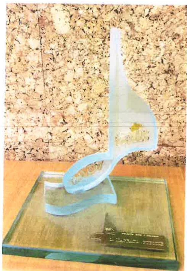
1. nagrada publike MIK 2007