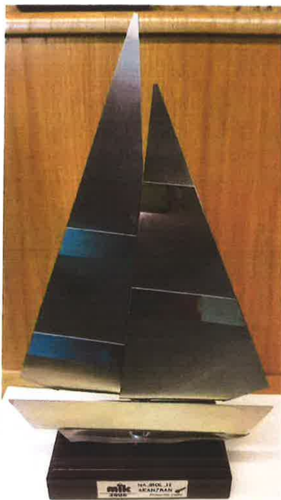
nagrada za aranžman MIK 1996