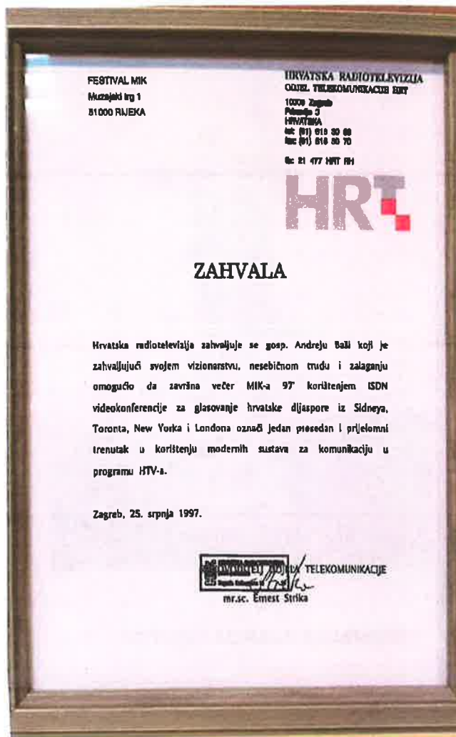
Zahvala HRT za globalni presedan: ISDN izravni video prijenos Toronto, New York, London, Sydney MIK 1997 Rijeka