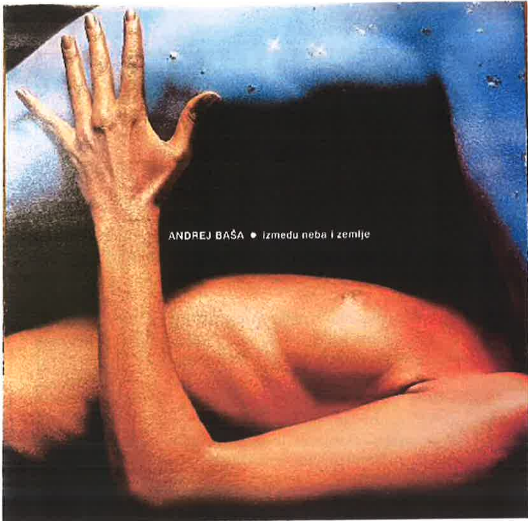
LP " IZMEĐU NEBA I ZEMLJE 1981 Jugoton / omot: Mirko Ilić