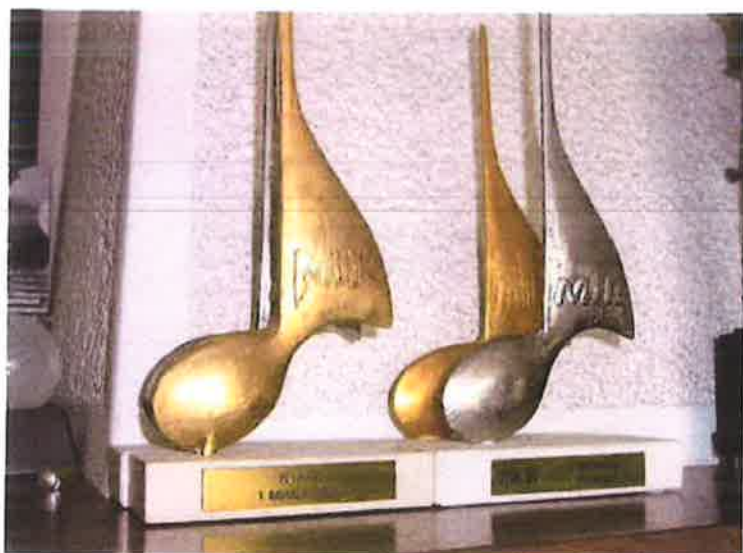
DIO NAGRADA NA "NOVOM" MIK-u