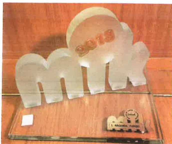
1. nagrada publike MIK 2013