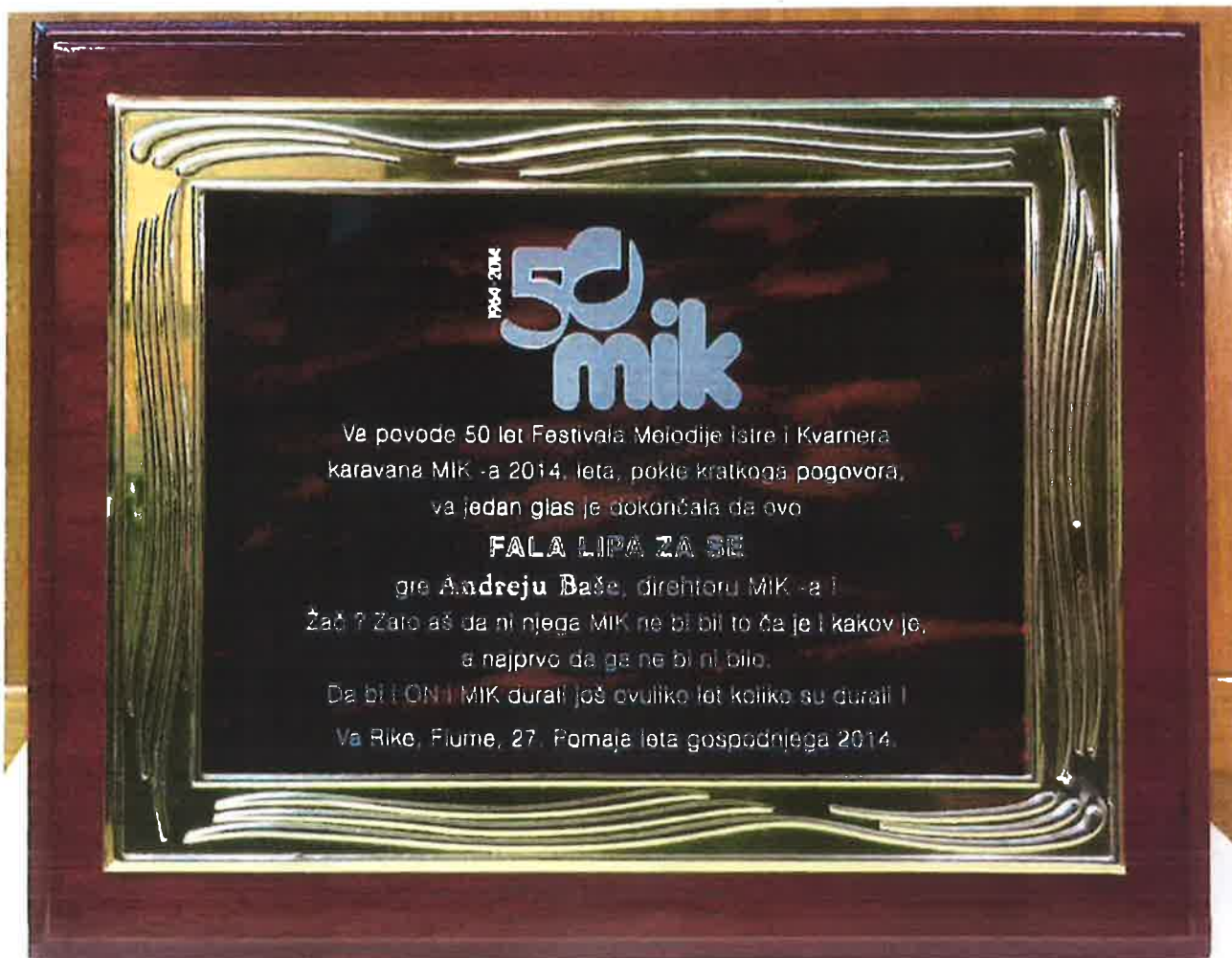
Fala lipa za se - zahvala ekipe MIK-a na 50 - godišnjici MIK-a