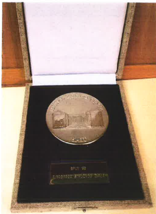
Split 1993 2. nagrada Žirija