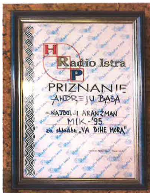
nagrada za aranžman MIK 95'