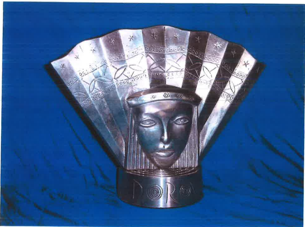
"DORA" 1993 I SUDJELOVANJE NA EUROSONGU KAO AUTORA I DIRIGENTA "Don't ever cry" grupa Put (Putokazi) Eurosong 1993