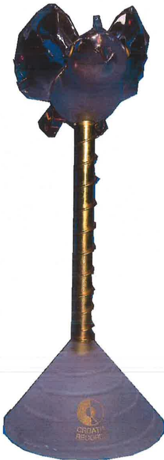
ZLATNA PTICA ZA ZASLUGE U DISKOGRAFIJI