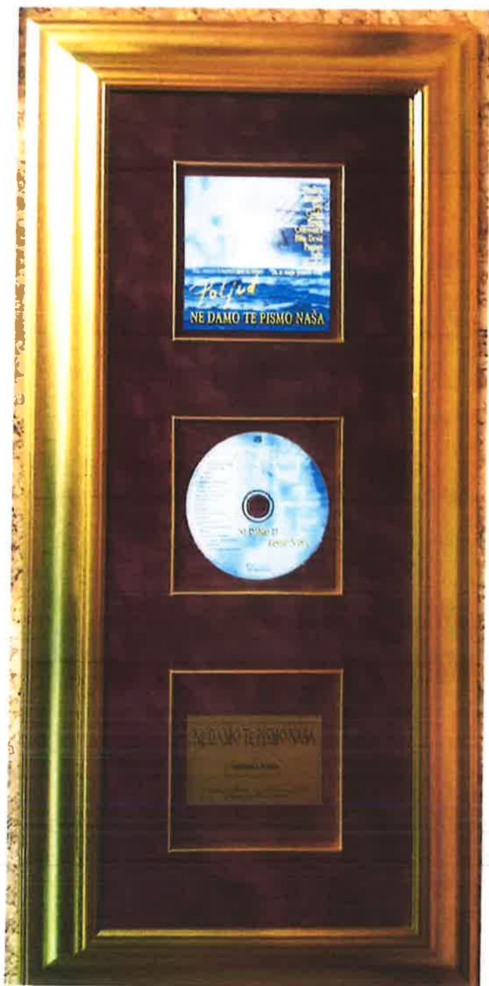
Ne damo te pismo naša - Poljud 2006 priznanje za izniman doprinos u očuvanju i negovanju hrvatske glazbene baštine