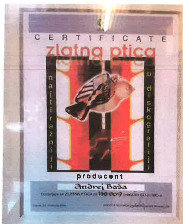
Zlatna ptica Croatia Records za producenta