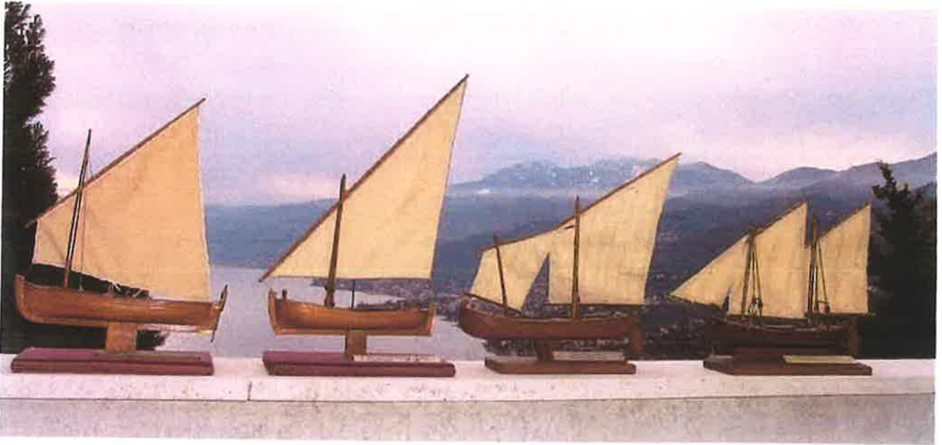
ČETIRI 1. NAGRADE NA "STAROM" mik-u 1977, 1979, 1982, 1983.