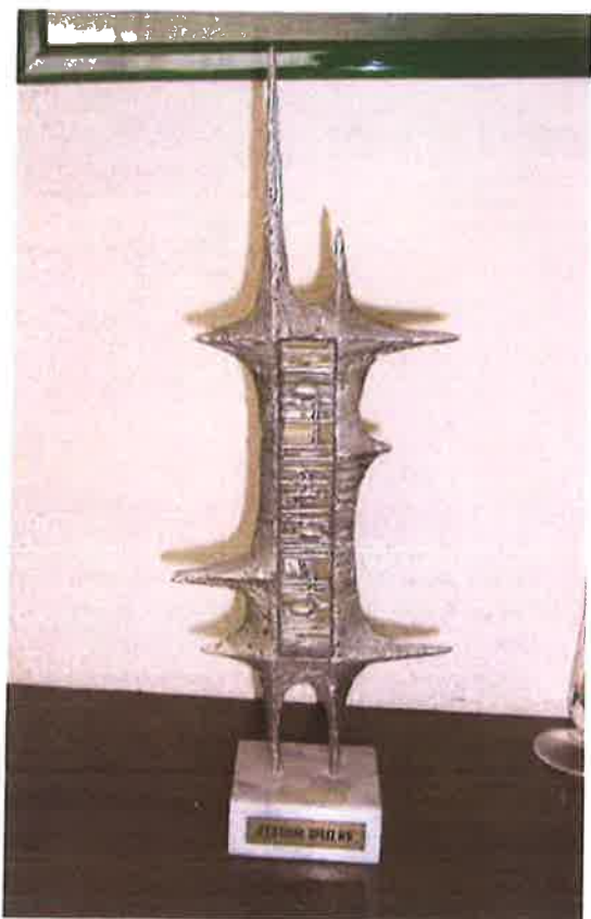
TROSTRUKA POBJEDA "SPLIT 85"