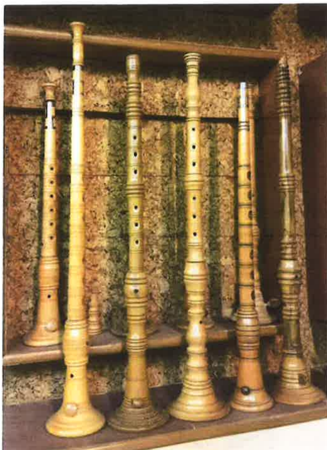
4 nagrade Roženice za Istraski melos