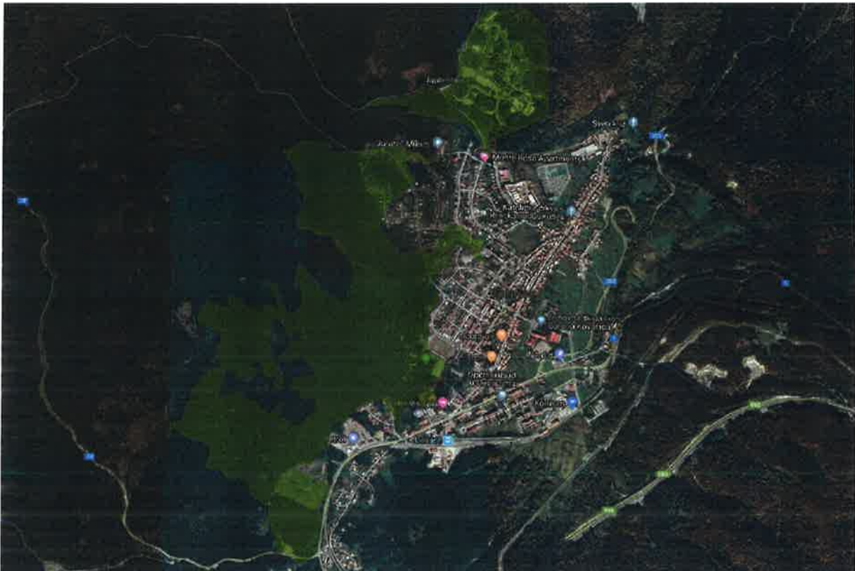
Slika 1. Aktualno područje Park-šume Japleniški vrh (površina 170,86 ha)

Prema prijedlogu izmjene granica, za razliku od dosadašnjeg stanja gdje su pojedinačne čestice unutar park-šume bile u vlasništvu Republike Hrvatske, Grada Delnica, privatnih posjednika i ostalih subjekata, cijelo područje bi se sastojalo od tri katastarske čestice koje su u čistom vlasništvu Republike Hrvatske, što bi također uvelike olakšalo upravljanje park-šumom.