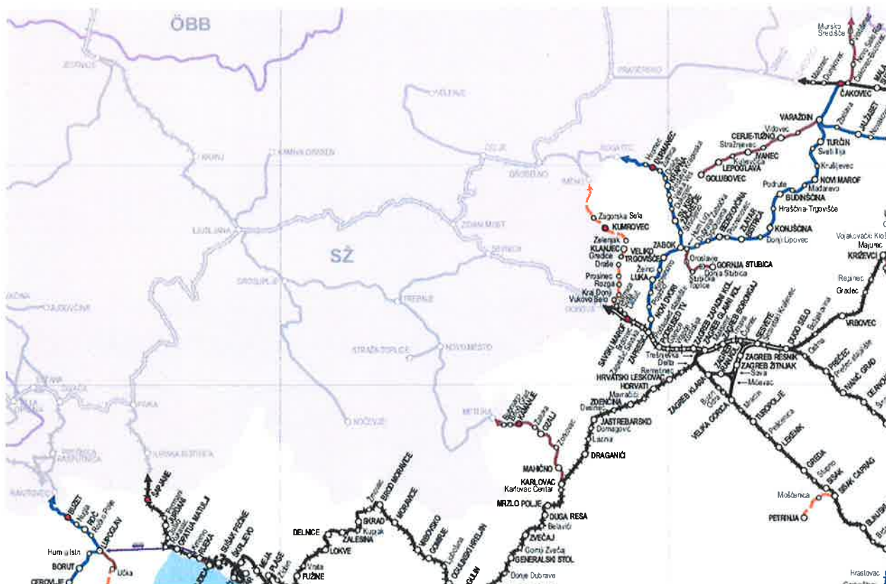
Slika 3: Željezničke pruge između republika Hrvatske i Slovenije

Prema trenutno važećem voznom redu Hrvatskih željeznica, samo je iz Zagreba moguće otputovati vlakom u Ljubljani te se isti dan vratiti.