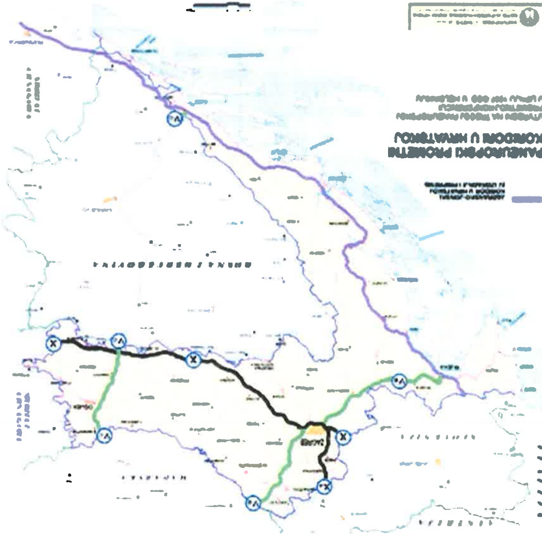
Slika 4: Jadransko-jonski koridor

Glavni planom je analiziran prometni sustav funkcionalne regije te su definirani ciljevi i mjere za optimalan razvoj prometnog sustava funkcionalne regije. Izradeni Glavni plan je podloga za definiranje projekata iz domene prometa te se očekuje da će predstavljati strateško utemeljenje za sve buduće prometne projekte, da