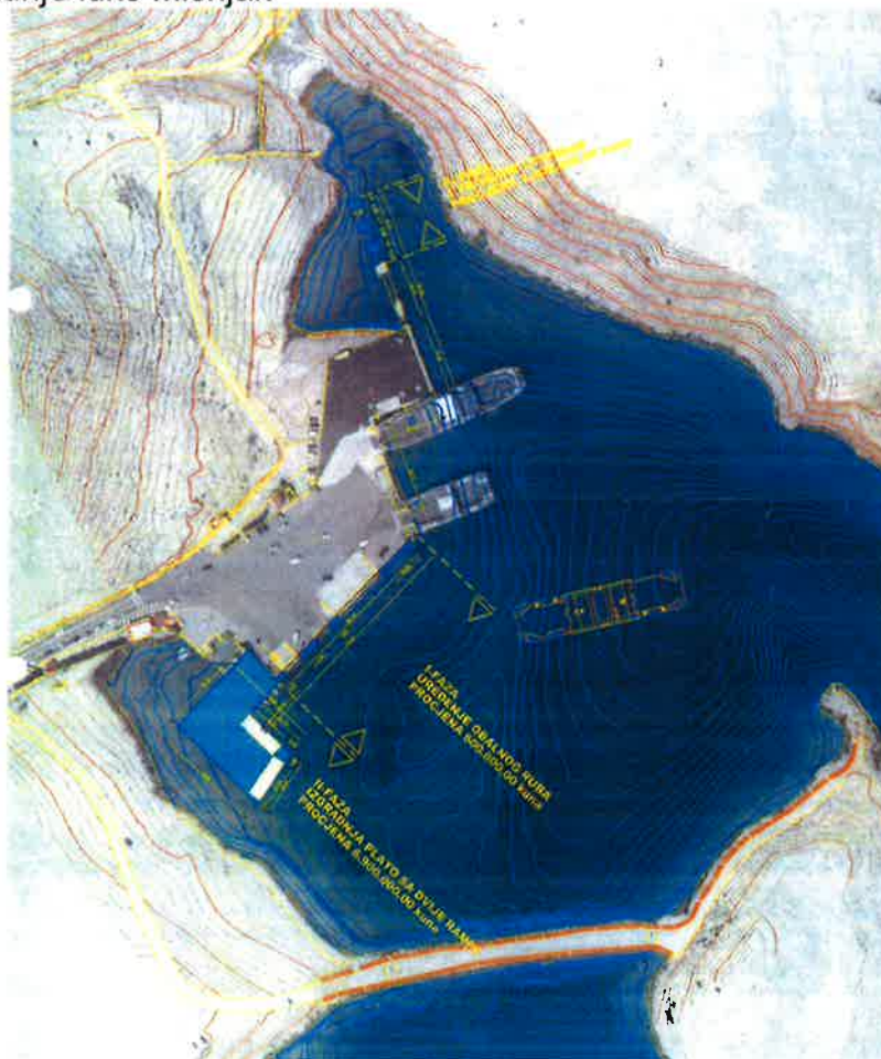
Skica dogradnje luke Mišnjak

Projekt je procijenjene vrijednosti 9.000.000,00 kuna sa PDV-om od čega je Županijska lučka uprava Rab prema Ministarstvu mora, prometa i infrastrukture prijavila zahtjev za sufinanciranje u iznosu od 7.000.000,00 kuna, Primorsko-goranskoj županiji u iznosu od 1.500.000,00 kuna, a Županijska lučka uprava Rab bi osigurala ostatak od 500.000,00 kuna.