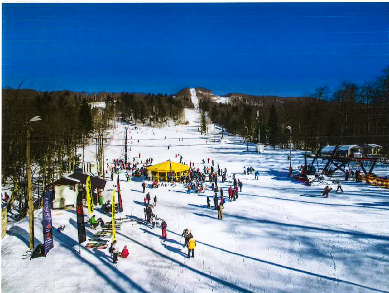
Objekti u skijaškoj zoni Radeševo – žičara, pokretna traka, tubeing, caffe rotonda, sanitarni čvor