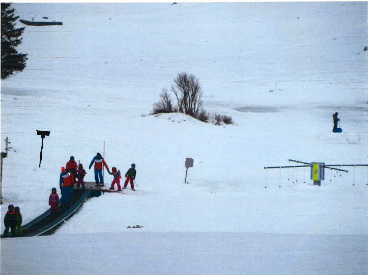
Pokretna traka Baby lift i višenamjenski vrtuljak