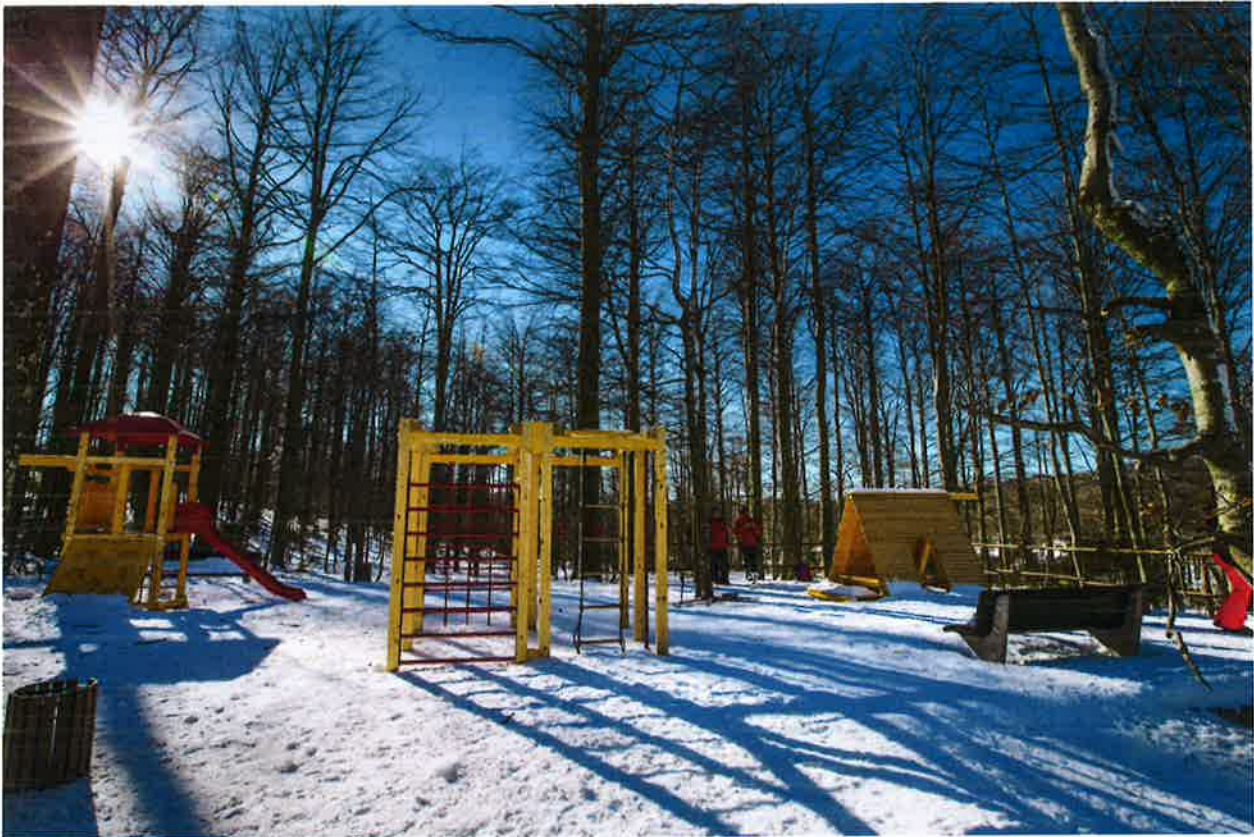
Dječje igralište na Platku