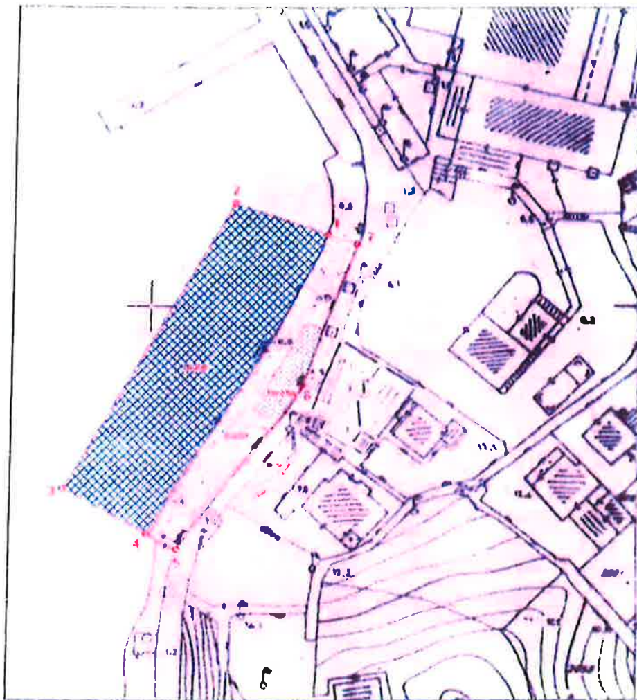
POPIS KOORDINATA KARAKTERISTIČNIH TOČAKA