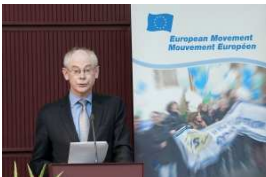
Herman van Rompuy

Sastanak je bio održan u predstavništvu Bavarije, a vodio ga je Pat Cox, predsjednik organizacije European Movement International.