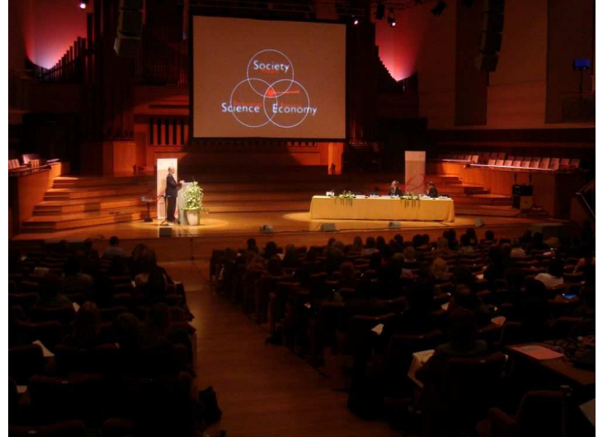
Tijekom konferencije Culture, creativity and innovation

Posebno je to nekako ostalo problematično meni koji dolazim iz zemlje koja inače ima problema sa poduzetničkim duhom. Kamo li ne s povezanošću poduzetništva s kulturom, koja se tradicionalno prikazuje isključivo kao potrošač.