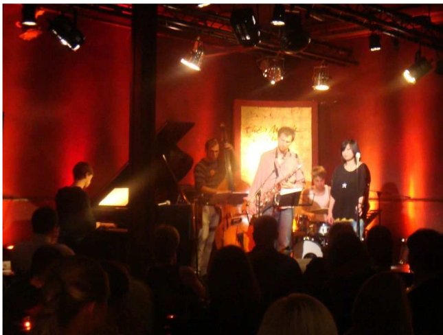
Atmosfera u jednom briselskom jazz baru