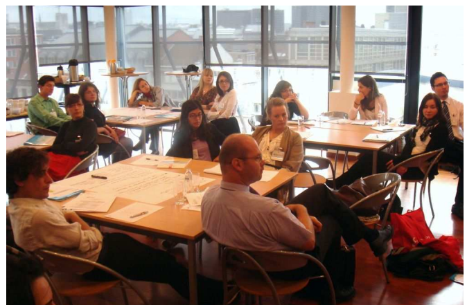
Tijekom trening akademije AER-a

Jedna od najvećih koristi koju sam ostvario na tom treningu je promjena pogleda na lobiranje i doista važan zaokret u mom pogledu na lobiranje u korist teze da je to "pomoć onima koji donose odluke da donesu pravu odluku". Osim predavača odlični su bili i polaznici, neki od njih stažisti u predstavništvima svojih regija, a neki poput mene, došli su iz svojih regija na učenje o europskim procesima. S nekima sam već u "follow-up" kontaktu, a preko nekih sam došao i do trećih osoba. Pravi networking, kažem kao uspješan polaznik treninga.