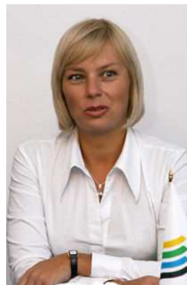
Poljska ministrica Elżbieta Bieńkowska

Nastavila je ustvrdivši da najbolji rezultati tek predstoje i da će se puni pozitivni učinci poljske uspješnice tek pojaviti u razdoblju između 2013. i 2015.g.