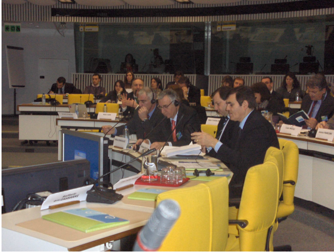
Sudionici radnog sastanka u Odboru regija

Radni sastanak izazvao je veliko zanimanje zastupnika u Europskom parlamentu koji su pozdravili inicijativu. Zastupnica i predsjednica parlamentarnog odbora za regionalnu politiku, Danuta Hübner, dala je poticaj i praktične savjete za obraćanje EU vijeću kako bi se u konačnici Europskoj komisiji naložilo pisanje i formalne verzije Jadranske strategije.