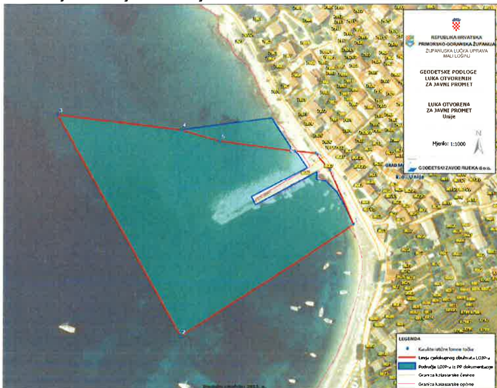
Slika 1. Postojeće stanje luke Unije