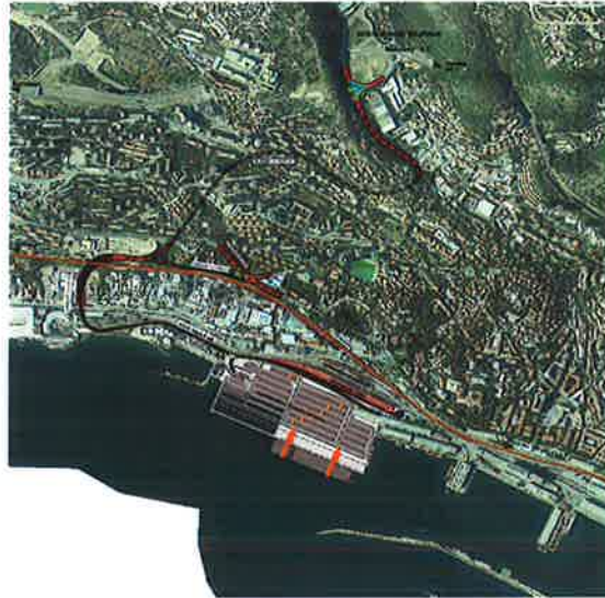
Trasa nove državne ceste - D403

Za uspjeh projekta Zagreb Deep Sea neophodna je dobra cestovna povezanost kontejnerskog terminala na mrežu hrvatskih autocesta odnosno na glavnu mrežu TEN-T koridora. Veza se osigurava putem državne ceste D403. Duljina ceste D403 od luke Rijeka (ZDSCT) do čvora Škurinje na riječkoj zaobilaznici iznosi približno 3 km s odvojkom za povezivanje na mrežu gradskih prometnica u Zvonimirovoj ulici. Prema dinamičkom planu radovi na izgradnji ceste D403 završavaju istovremeno kada i investicija koncesionara na Zagreb Deep Sea kontejnerskom terminalu.