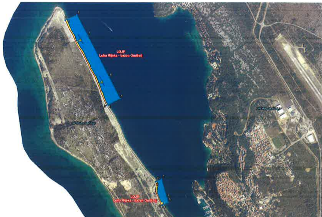
Luka Rijeka – bazen Omišalj