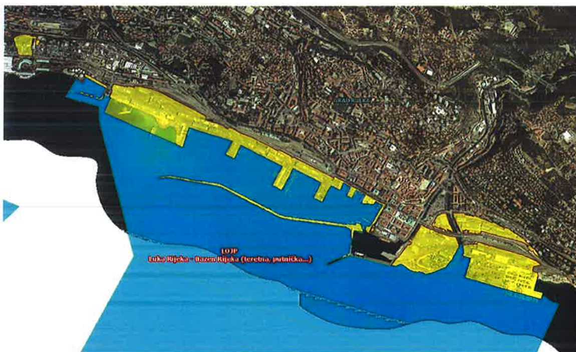
Luka Rijeka – bazen Rijeka s lokacijama Pioppi, Mlaka, Rijeka, Delta Sjever, Delta Jug, Brajdica Sjever, Brajdica Jug te dva sidrišta: Zapadno i Istočno sidrište i bazen Zamet