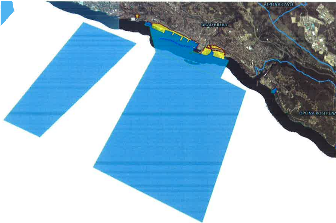
Luka Rijeka – Bazeni Rijeka i Zamet sa Zapadnim i Istočnim sidrištem