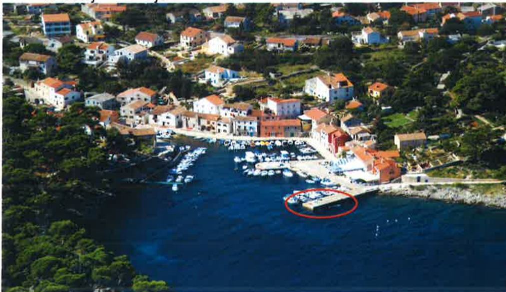
Slika 1. Postojeće stanje luke Rovenska