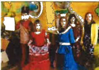
Slika 44. - Praznici u Muzeju, 2019.