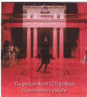
Slika 39. - Naslovnica tiskanog izdanja Tia putuje kroz 120 godina Guvernerove palače