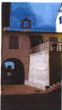
Slika 5. Muzejska zbirka Kastavštine, Prolaz Ivana iz Kastva 1, Kastav