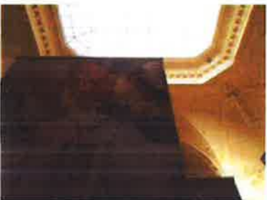
Slika 28. - Izložba povodom proslave 70. godine djelovanja Ansambla narodnih plesova i pjesama Hrvatske LADO u Muzeju, 2019.