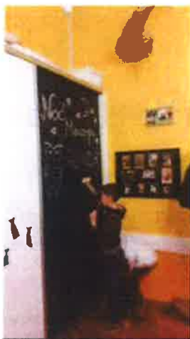
Slika 41. - Noć muzeja u Čudotvornici, 2019.