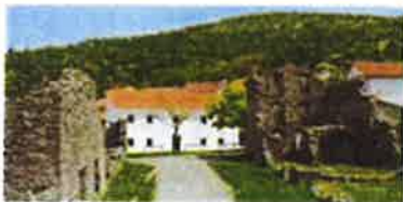
Slika 4. Muzejska zbirka Lipa, smještena u Memorijalnom centru Lipa pamti, Lipa 35, Šapjane