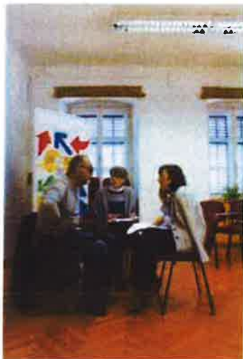
Slika 51. - Muzej budućnosti - radionice s partnerima na projektu