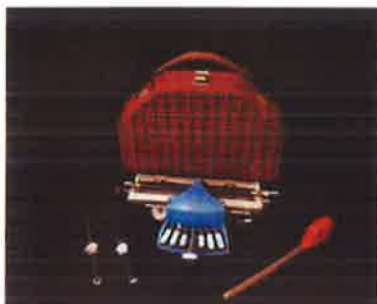
Slika 38. - Dio darovane građe Udruge slijepih Primorsko-goranske županije

Interaktivni vodič za djecu Tia putuje kroz 120 godina Guvernerove palače u svom je tiskanom izdanju objavljen 2016. godine uz projekt obilježavanja 120 obljetnice izgradnje palače. Nakon tiskanog izdanja Muzej je tijekom 2019. godine učinio iskorak u prezentaciji i interpretaciji prostora nekadašnje guvernerove rezidencije i predstavio audio vodič na hrvatskom i engleskom jeziku. Tijekom 2020. godine Muzej planira povećati broj audio vodiča kako bi se ovaj vrijedan način proširenja mogućnosti prezentacije ponudio što većem broju korisnika. Planirani izvori financiranja: Primorsko-goranska županija, vlastita sredstva.