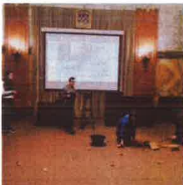
Slika 46. - Dramci iz Guvera tijekom predstave u Noći muzeja 2019.

kulturno-povijesne baštine kraja u kojemu Čudotvornica na putu gostuje izvan prostora Muzeja. Svojim radionicama Čudotvornica je do sada prodonijela obilježavanju raznih manifestacija poput Kreativne šetnice u Kostreni 2016., Kostrenskog SOLsticija 2016., Adventa u Cresu 2016., Antičkih dana u Omišlju 2017. i 2018., DŽEP-a, dječjeg festivala malih i minijaturnih scena Teatra OZ, u Brseču 2017. i 2018.