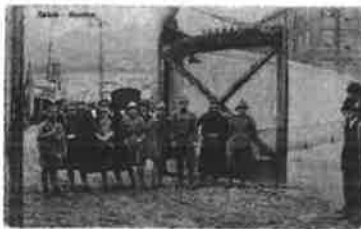
Slika 23. - Sušak - Granica, razglednica, Sušak 1931. godina, PPMHP 123689