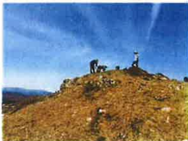
Slika 32. - Arheološka istraživanja lokaliteta Fortica, Mrkopalj u suradnji s udrugom Processus Mointanus, 2019.