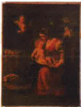
Slika 15. - Bogorodica s Djetetom, PPMHP 123682, nepoznati autor, 18 st.

Po završetku konzervatorsko-restauratorskih radova, odjeća će se izložiti u stalnom postavu u adekvatnim vitrinama i u skladu s preporukama HRZ-a. Vitrine je potrebno nabaviti do završetka restauratorskih radova.