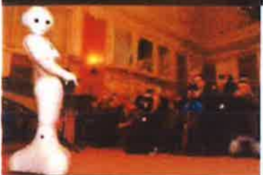
Slika 19. - Noć muzeja, 2019.