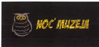
Slika 18. - Noć muzeja, logo