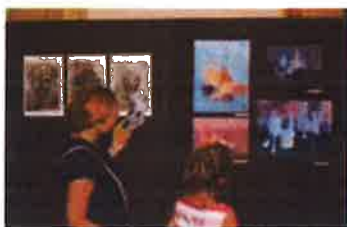
Slika 45. - Izložba radova Muzejskog malog ateljea, 2019.