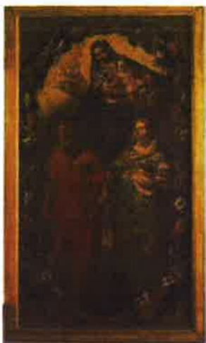
Slika 13. - Bogorodica s Djetetom, Marijom Magdalenom i Sv. Jeronimom, PPMHP 107356, nepoznati autor, 18.st.