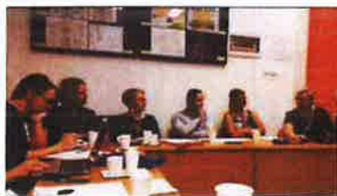
Slika 52. - partnerski sastanak na projektu E-VOKED (Erasmus+) u Muzeju, listopad 2019.

Cilj ovog projekta je razmjena iskustava i razvoj zajedničkih primjera dobre prakse u muzejima za rad s posebnim obrazovnim skupinama - učenicima strukovnih škola i studentima određenih struka vezanih za trgovinu, turizam, pomorstvo, tekstil ili ugostiteljstvo.