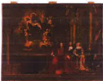
Slika 14. - Obitelj Barbadicus i Pieta, PPMHP 107402, nepoznati autor, 17. st.