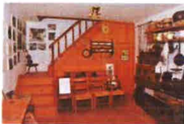
Slika 6. Etnografska zbirka otoka Krka u Dobrinju, Dobrinj 106, Dobrinj

- daje u najam prostore, muzejsku opremu i građu za izložbe, znanstvene, kulturne i ostale svrhe;