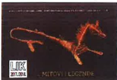
Slika 20. - LIK 2017./2018., plakat