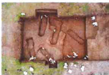
Slika 7. Grobnik - Grobišće, istraživanje lokaliteta, 2019.