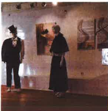
Slike 33. - Gostovanje izložbe Rigojanči-ljubav kao slatko nadahnuće u Mađarskom kulturnom institutu u Zagrebu, 2019.