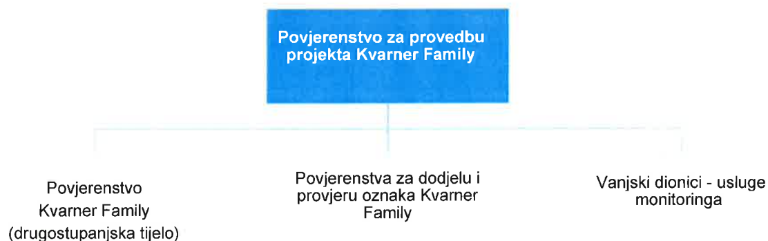
Shema 1 Organizacijska struktura sustava za implementaciju i provedbu projekta Kvarner Family

Dosadašnji dionici uključeni u praćenje implementacije i provedbe projekta predlažu se organizirati na sljedeći način: