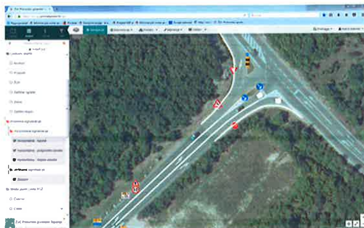
Pregled vertikalne signalizacije s atributima

upravljanje prostornim podacima te uspostaviti bazu podataka u kojoj se objedinjuju svi prostorni podaci o cestama i cestovnoj infrastrukturi.