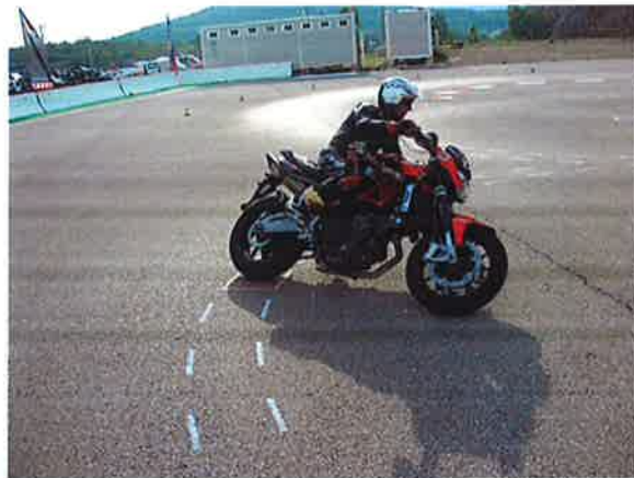
Kandidat na praktičnom dijelu obuke

Praktični dio programa, zbog jake kiše, proveo se sedam dana kasnije.