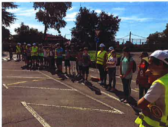
Smotra nove generacije školskih prometnih jedinica

U suradnji sa Upravnim odjelom za pomorsko dobro, promet i veze Primorsko-goranske županije 11. rujna 2018. na poligonu Doma mladih održala se uz nazočnost mentora i predstavnika medija smotra nove generacije pripadnika Školskih prometnih jedinica.