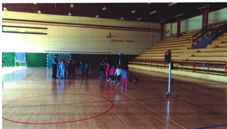
Praktični dio obuke u OŠ I.G.Kovačić, Delnice

I ove godine čitav tijek provođenja edukacije sniman je video kamerom, te su učenici po završetku nastave dobili video zapis s kojim će moći u svojim školama ponoviti i obnoviti stečena znanja kao i uvidjeti i ispraviti prepoznate nedostatke.