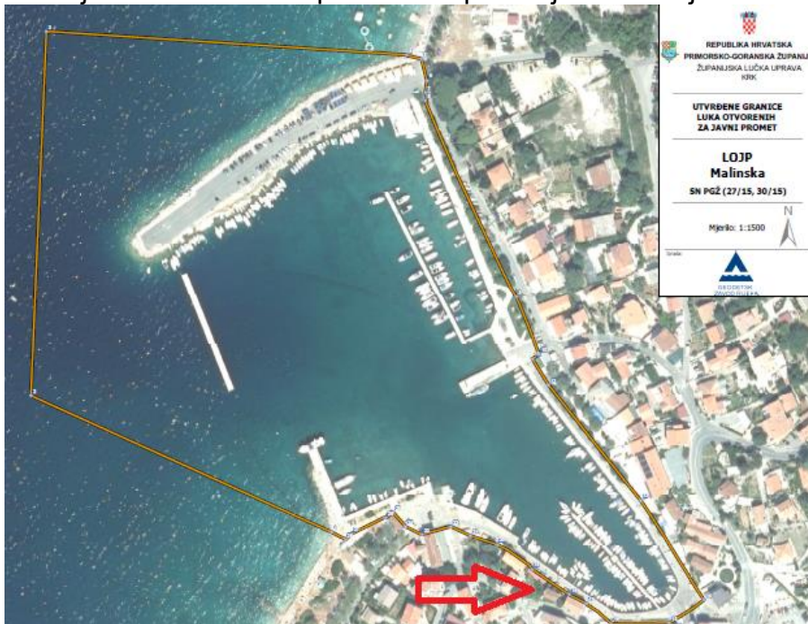
Slika 2. Područje luke Malinska s prikazanim područjem sanacije

Ukupna površina obuhvata iznosi 456 m 2 (prije proširenja obale) odnosno 534 m 2 (nakon proširenja obale).