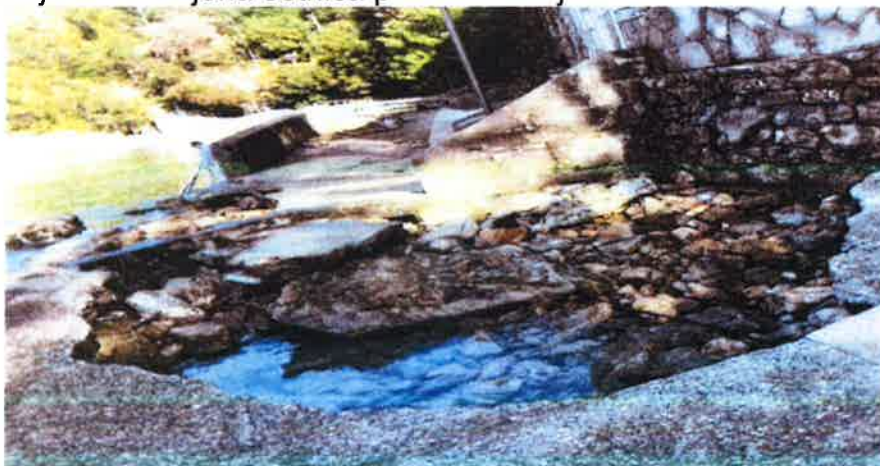
Fotografija 3. Razbijena šetnica plaže S zavoj