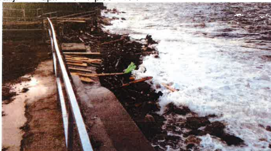
Fotografija 1. Naplavine na plaži Preluk