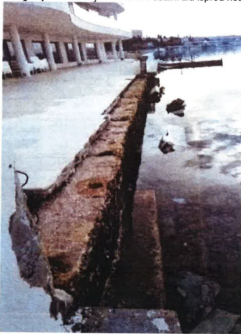
Fotografija 11. Razbijeni betonski obalni zid ispred hotela Amabilis u Selcu