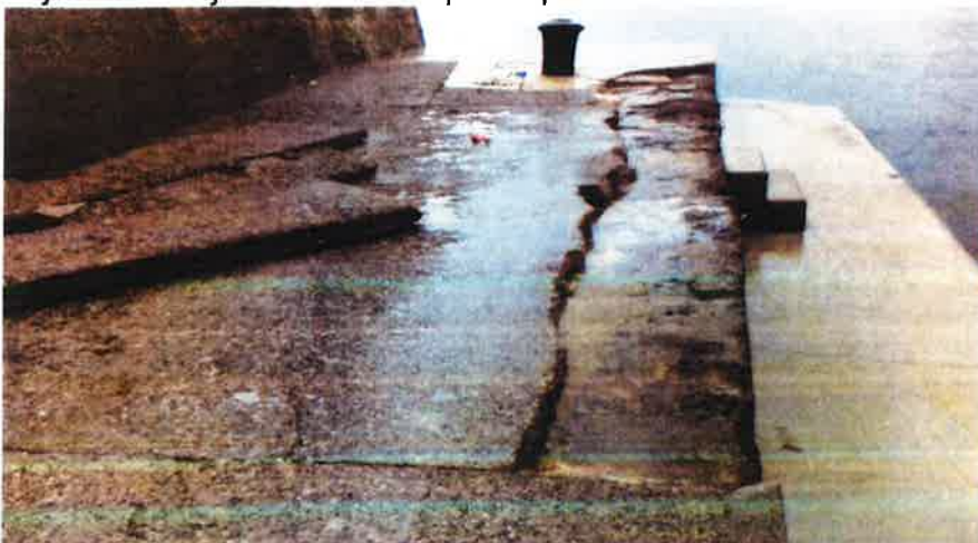
Fotografija 2. Razbijena betonska ploča plaže Preluk