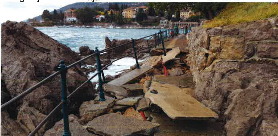
Fotografija 7. Oštećenja šetnice u Iki