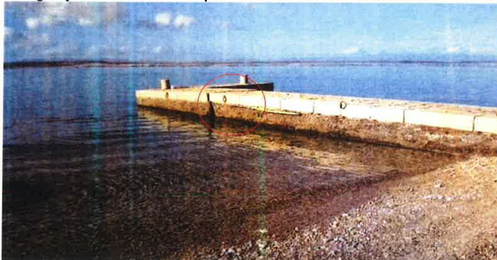
Fotografija 9. Puknuta riva ispred hotela Mediteran

Potopljena je nekoliko plovila na vezovima i vozila na parkiralištima uz obalu te oštećena oprema sportskih klubova.