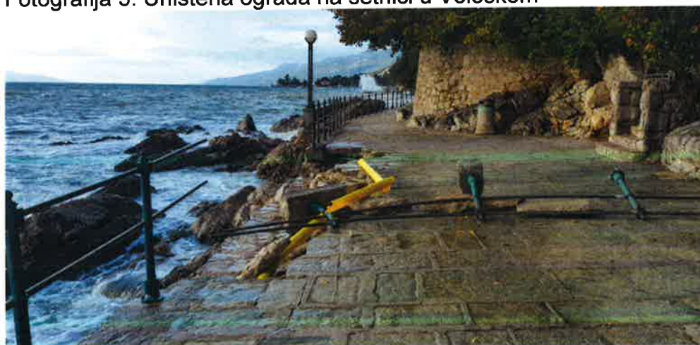
Fotografija 5. Uništena ograda na šetnici u Voloskom