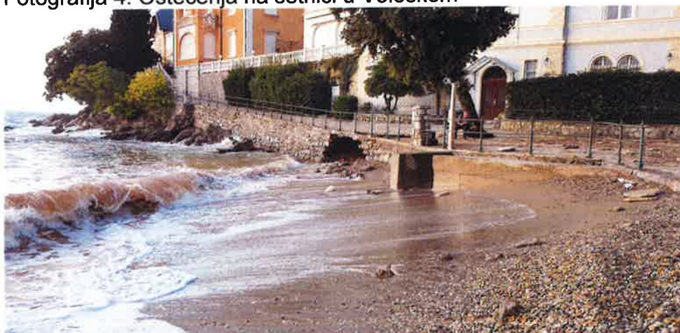
Fotografija 4. Oštećenja na šetnici u Voloskom

Ističu da su na području Grada Opatije štetu pretrpjeli i brojni drugi gospodarski objekti npr. kupalište Lido, plaža Slatina, plaža hotela Savoy te objekti u luci Opatija – restoran Molo, restoran Bevanda, te je potopljeno više plovila u lukama na području Grada Opatije.