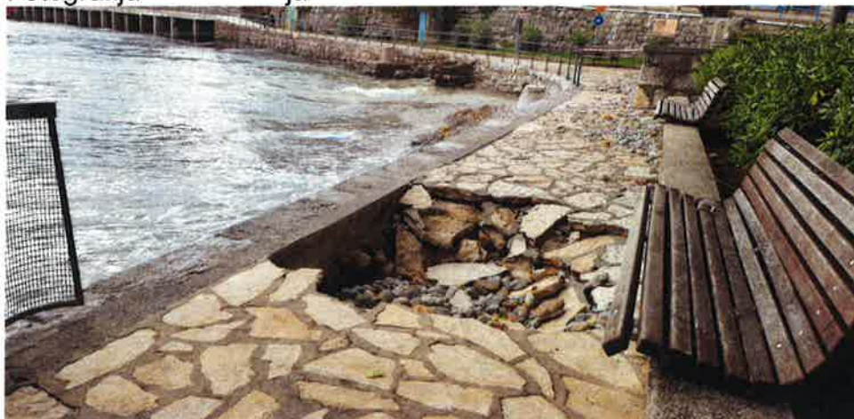
Fotografija 6. Oštećenja šetnice u Iki