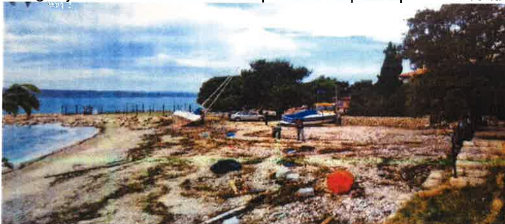
Fotografija 10. Uništena sunčališna površina na plaži ispred Life centra