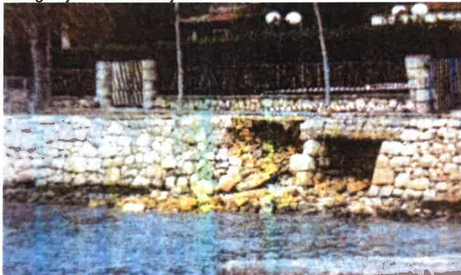
Fotografija 13. Oštećenja na šetalištu kod hotela Omorika