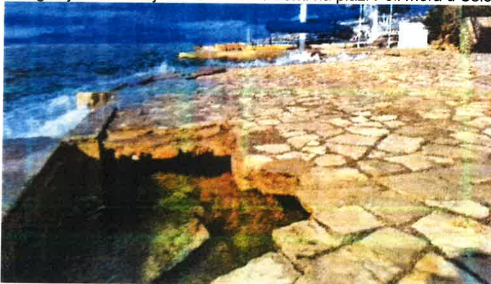
Fotografija 12. Razbijeni betonski elementi na plaži Poli mora u Selcu