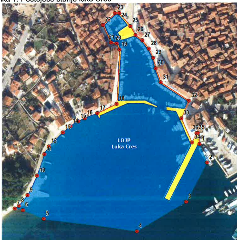
Slika 1. Postojeće stanje luke Cres

Projektom rekonstrukcije i dogradnje zapadnog dijela luke Cres potrebno je postojeći pristan dograditi i time osigurati nužnu zaštitu akvatorija unutar lučkog područja luke Cres, omogućiti adekvatan privez i sigurnost na vezu za linijske brodove, osigurati