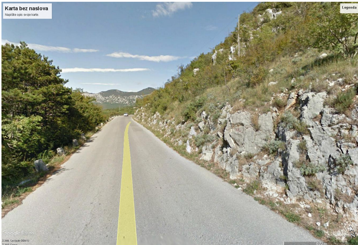
Slika 6. Slika zahvata

Javno otvaranje ponuda održano je dana 7. lipnja 2018. godine, a pristigle su ukupno 2 (dvije) ponude, kako slijedi: