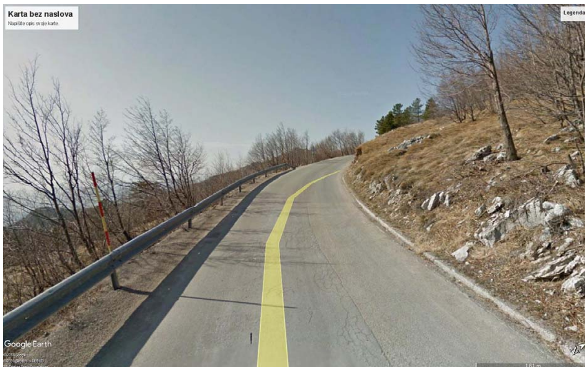
Slika 4. Slika zahvata

Javno otvaranje ponuda održano je dana 7. lipnja 2018. godine, a pristigle su ukupno 4 (četiri) ponude, kako slijedi: