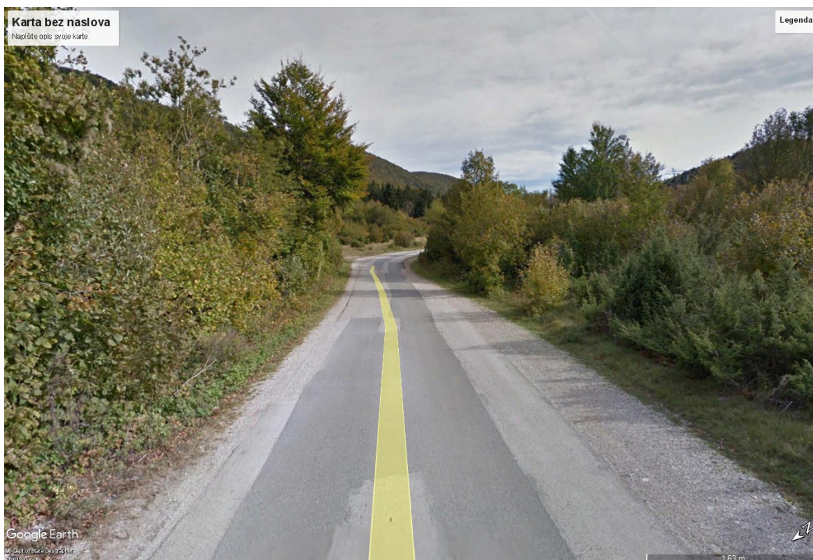
Slika 2. Slika zahvata

Javno otvaranje ponuda održano je dana 7. lipnja 2018. godine, a pristigle su ukupno 3 (trit) ponude, kako slijedi: