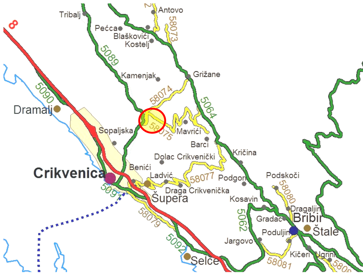
Slika 5. Lokacija zahvata