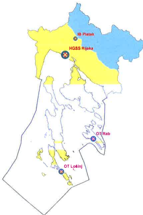
Slika 2. Područje pokrivenosti HGSS Stanice Rijeka u PGŽ.

U strateškom planu je osnovati i obavještajnu točku na Krku čim se ustanove neophodni ljudski potencijali. Navedeno se pokazalo kao dobra praksa jer su članovi OT-a imali veliki broj intervencija u kojima su spašeni ljudski životi.