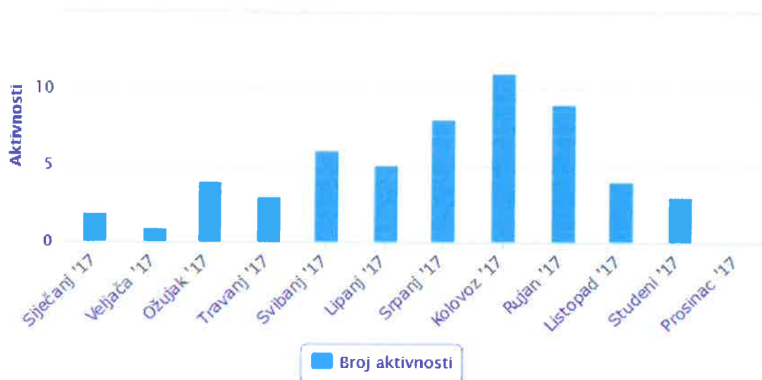
Grafikon 1. Prikaz broja akcija spašavanja NA POZIV po mjesecima.

U statistiku su uvrštene samo intervencije kod kojih je HGSS Rijeka izašla na teren s ljudstvom, vozilima i tehnikom, tj. nisu uvrštene situacije pripravnosti (kada su članovi HGSS Stanice Rijeka bili spremni za polazak). Također nisu uvrštene situacije kada je pružena pomoć putem mobilnog telefona.