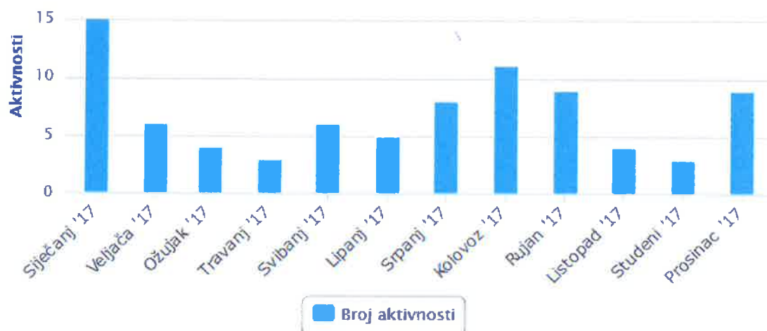
Grafikon 2. Prikaz svih intervencija po mjesecima.

Analiza intervencija nalazi se u donjoj tablici iz koje je vidljivo da je spašeno i pružena neposredna pomoć za 87 unesrećenih ili ozlijeđenih osoba. Direktno je spašeno 28 osoba, u potražnim akcijama tragalo se za 16 osoba, u dodatnih 7 potraga uslijedilo je spašavanje 6 osoba, dok je kroz tehničke intervencije pomoć pružena za 5 osoba.