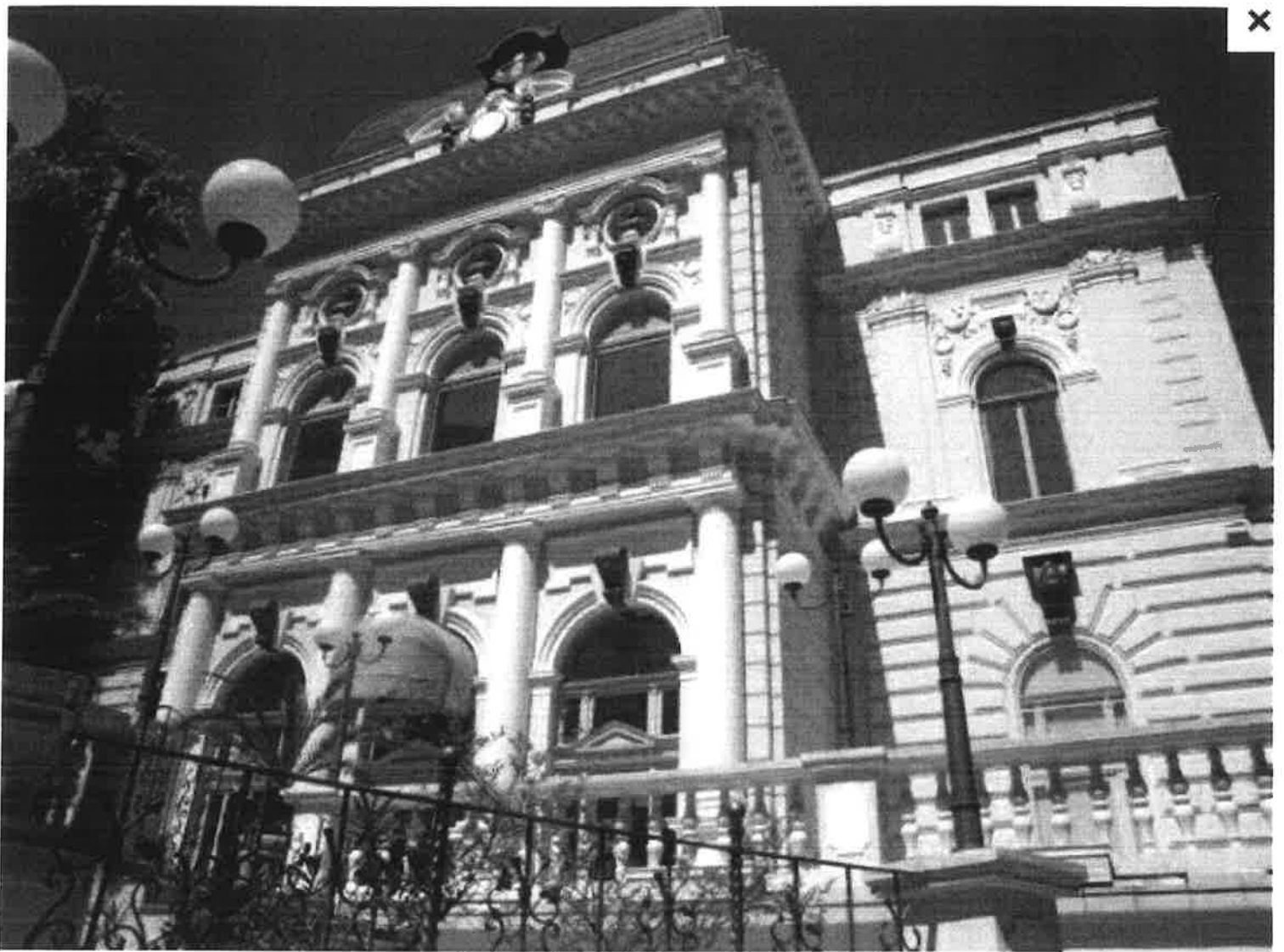
Zgrada Operetta u Opatiji