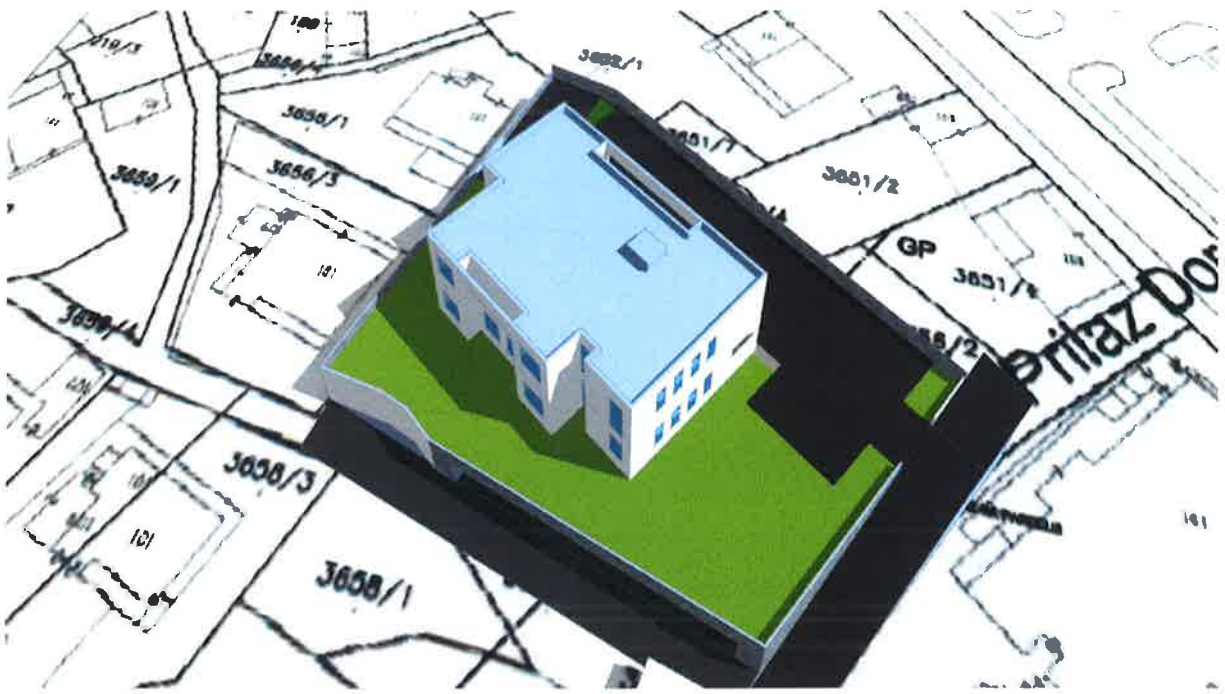
Slika 2. 3D projekcija građevine