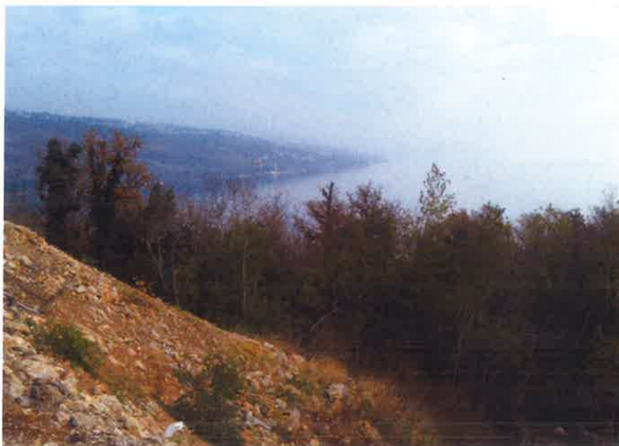
Slika 1 Pogled s vrha parcele prema Rijeci