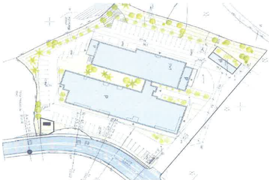
Slika 2. Pregledna situacija