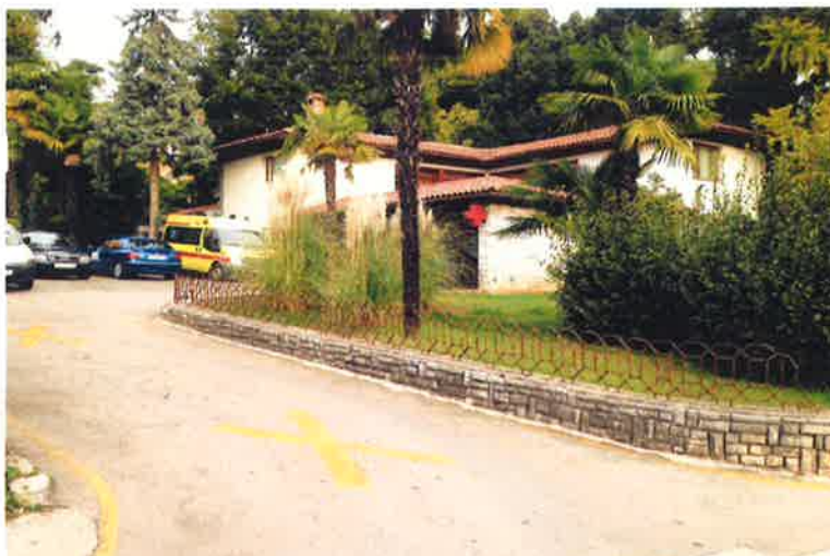
Slika 4. Postojeći objekt Hitne pomoći, Vladimira Nazora 4

Župan je 13. veljače 2017. donio Odluku o osnivanju Koordinacijskog tima (KLASA: 022-04/17-01/6, URBROJ: 2170/1-01-01/5-17-38 od 13. veljače 2017.) i Projektnog tima za operativnu provedbu projekta izgradnje objekta Doma zdravlja u Opatiji (KLASA: 022-04/17-01/6, URBROJ: 2170/1-01-01/5-17-39 od 13. veljače 2017.).