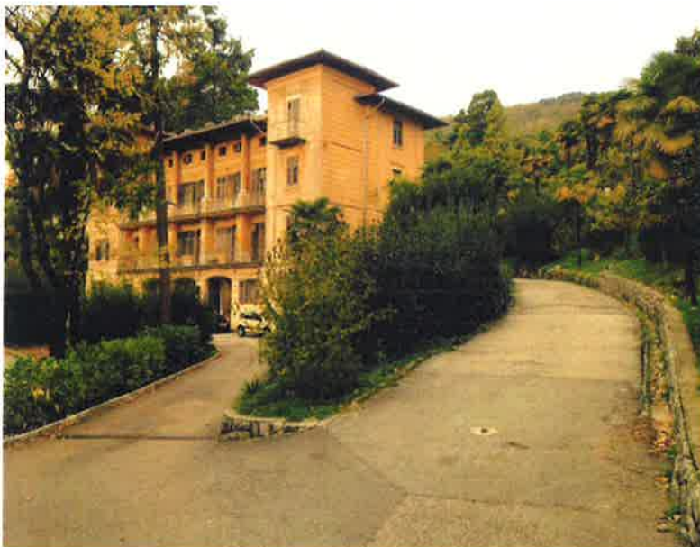
Slika 3. Postojeći Dom zdravlja Opatija, Stube Vande Ekl 1

Dom zdravlja planira financirati investiciju prodajom nekretnina u svom vlasništvu. Procijenjena tržišna vrijednost nekretnine postojećeg Doma zdravlja u Opatiji na adresi Stube dr. Vande Ekl 1 je 22.950.000,00 kn, dok je tržišna vrijednost zgrade hitne medicinske pomoći na adresi Vladimira Nazora 4 u Opatiji 7.550.000,00 kn što ukupno iznosi 30.500.000,00 kn.