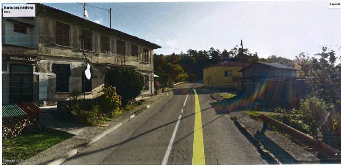
Slika 2. Današnje stanje ceste

(izrađivač Topoing d.o.o. Kastav). Obje spomenute dokumentacije su u potpunosti financirane sredstvima Proračuna Primorsko-goranske županije u 2016. godinu u ukupnom iznosu 121.875,00 kn.