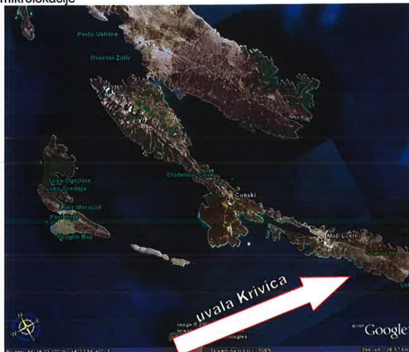
Slika 1: Prikaz mikrolokacije

U prethodnom postupku, a na temelju članka 2. točka 5. i članka 7. stavak 4. Zakona o pomorskom dobru i morskim lukama provjerena je usklađenost inicijative s prostorno-planskom dokumentacijom, te status granice pomorskog dobra i upis čestica kao pomorsko dobro u zemljišnim knjigama.