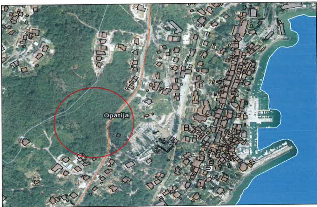
Slika 1. Lokacija građevine na k.č. 385/5 k.o. Volosko

Osim navedenog, u cilju što lakše prodaje postojećih nekretnina, Grad Opatija je prihvatio sugestiju Doma zdravlja PGŽ-a da se u prvim slijedećim izmjenama PPUG Opatije promjeni namjena zemljišta na kojima se nalaze predmetne nekretnine te da se omogući osim zdravstvene i turističke i izgradnja građevina ostalih namjena (stambena, poslovna i sl.). U međuvremenu je Gradsko vijeće Grada Opatije na sjednici održanoj 4. listopada 2016. godine donijelo Odluku o izradi izmjena i dopuna urbanističkog plana uređenja naselja Opatija (UPU 1) (Sl. nov. PGŽ, broj 26/16).