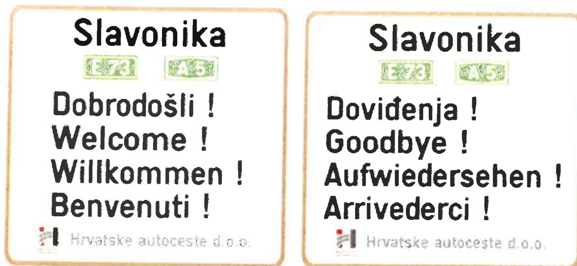
Slika 2. Znak pozdrava na ulazu ili izlazu s autoceste

Većina javnih cesta se već dugi niz godina nazivaju imenima koji nisu službena. Tako je npr. autocesta A1 od čvora Bosiljevo do Dubrovnika poznatija kao "Dalmatina", državna cesta D8 poznatija kao "Jadranska magistrala", a državna cesta D3 poznatija kao "Luzijana". Slične primjere nalazimo i u susjednim državama, tako npr. autocesta u Italiji od Trsta do Torina ima oznaku A4, ali je poznatija kao "Serenissima".