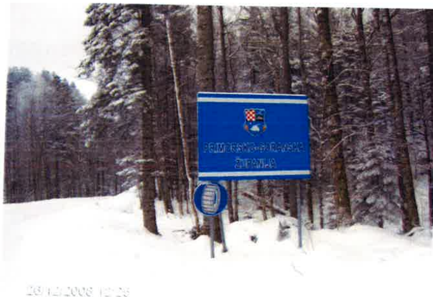
Slika 1. Izgled znaka

Primorsko-goranska županija je još 2001. g. postavila 37 znakova obavijesti na 23 lokacije na ulazu u županiju (pregledna karta nalazi se u prilogu 1), izgledom kao na slici 1.