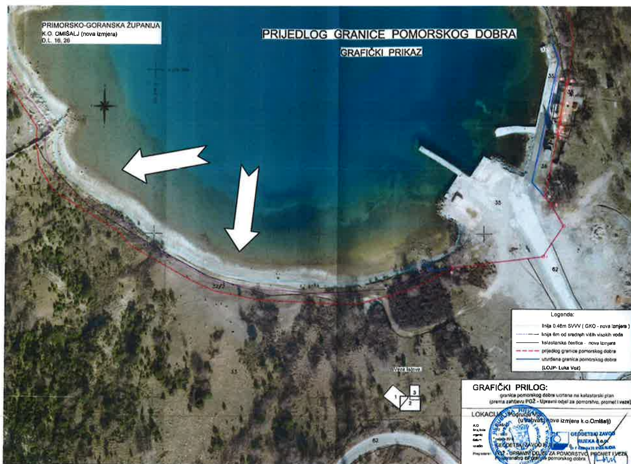
Slika 1.: Granica pomorskog dobra (označeno crvenom linijom)

Granica pomorskog dobra utvrđena je Rješenjem Povjerenstva za granice Ministarstva mora, prometa i infrastrukture od dana 13. srpnja 2010. godine.