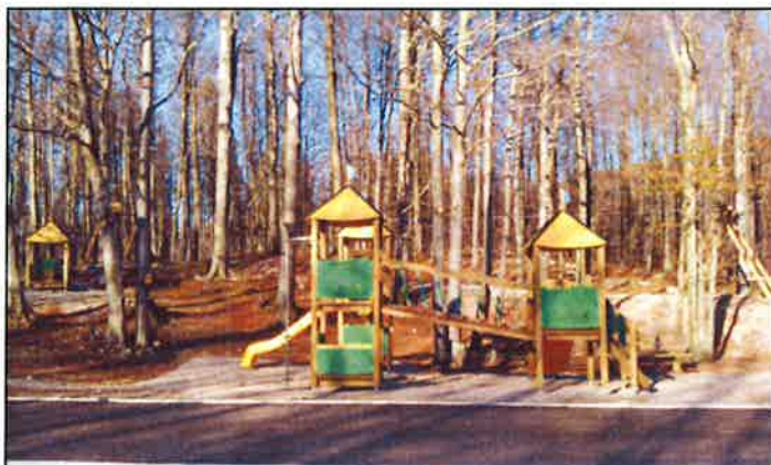
Dječje igralište na Platku

Na skijalištu RSRTC Platak do izgradnje planiranih objekata, nabavom kontejnera djelomično su riješene potrebe smještaja pratećih službi i usluga skijališta. U tu svrhu dobavljeni su kontejneri za smještaj HGSS, kontejner za prodaju karata, za skladišni prostor te za sanitarije. U 2015. je nabavljeno još tri kontejnera za potrebe skladišta. Za nesmetano korištenje kontejnera sanitarija na Radeševu izvedeni su potrebni građevinski radovi izgradnje nadstrešnica.