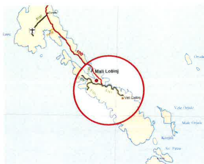
Slika 1. Položajna karta

Mreža javnih cesta na području Grada Malog Lošinja obuhvaća i županijsku cestu oznake Ž-5161, opis ceste Mali Lošinj (D 100) - Veli Lošinj, duljine 3,4 km, kako je to prikazano na slici 1.