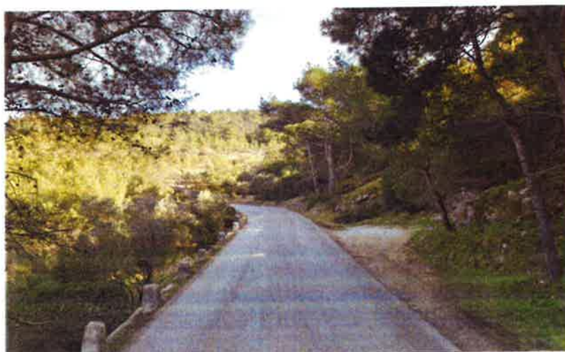
Slika 2. Današnje stanje ceste

Za gospodarenje i održavanje iste nadležna je Županijska uprava za ceste Primorsko-goranske županije (dalje u tekstu: ŽUC). Sadašnje stanje ceste je takvo da ista nije dovoljne širine za nesmetano odvijanje dvosmjernog prometa, umjesto propisanih 5,5 širine, ista je široka 5,0 - 5,2 m i nema razdjelnu bijelu crtu po sredini (slika br. 2.). Imajući u vidu da se radi o turističkoj destinaciji, na navedenoj cesti nije moguće mimoilaženje dva autobusa.