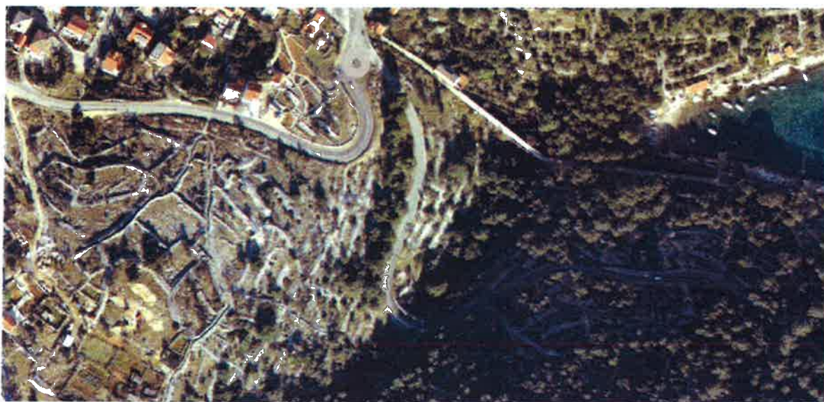
Slika 4. Postojeće stanje spoja 3 ceste

Sudionici su suglasni da se ukupni dosadašnji troškovi u iznosu 375.000 kuna podijele na 1/3 (Grad Mali Lošinj, PGŽ te Jadranka d.d.)