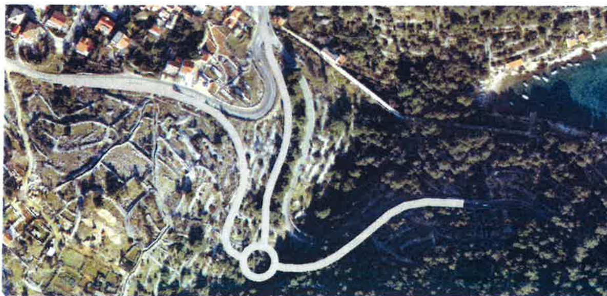
Slika 5. Planirano stanje spoja 3 ceste

Ovim se materijalom predlaže tekst Sporazuma o reguliranju međusobnih prava i obveza između Primorsko-goranske županije, Grada Malog Lošinja, Jadranka