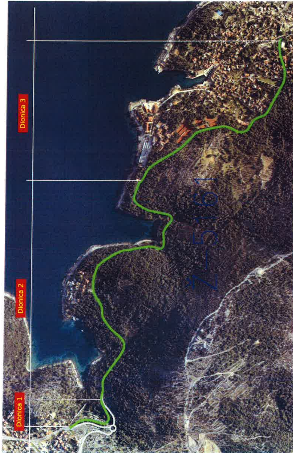
Slika 6. Grafički prikaz rekonstrukcije ceste po dionicama

d.d. i ŽUC-a kao nositelja cijelog posla, a predmet kojeg bi bilo projektiranje novog rotora s povezivanjem na postojeće ceste i rekonstrukcija postojeće ceste (slika 6.) uzimajući u obzir da bi ovakvo rješenje ipak trajno riješilo prometnu povezanost i problematiku na predmetnom području, s omjerima u sufinanciranju s po 1/3 (Grad Mali Lošinj, Županija i Jadranka d.d.)