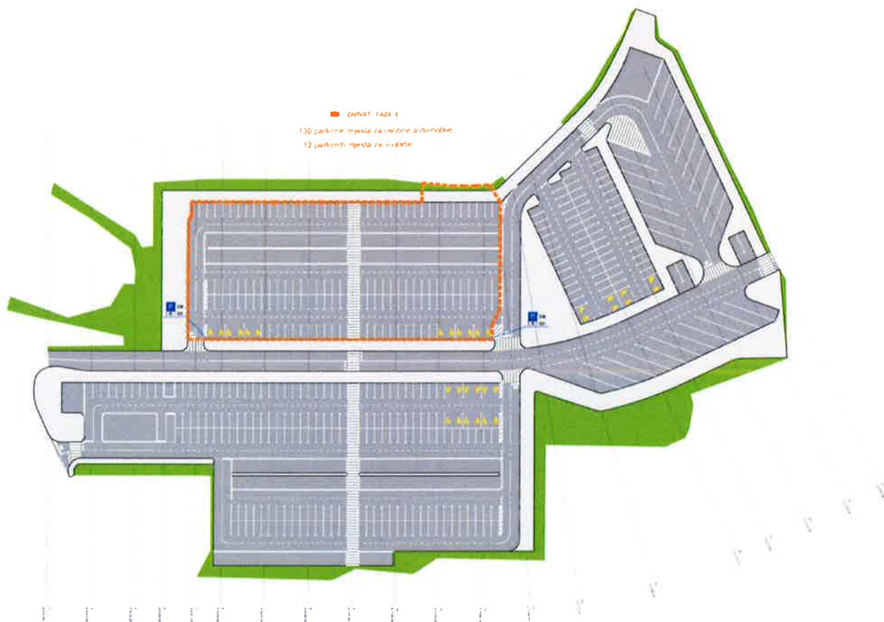
Grafički prikaz 1: Prometno rješenje parkirališta Platak

Kako bi se osigurala željena dinamika provedbe investicije, voditelj Projektnog tima i direktor GSC-a dužni su redovito, a najmanje jednom mjesečno, izvještavati pročelnika Upravnog odjela za regionalni razvoj, infrastrukturu i upravljanje projektima o