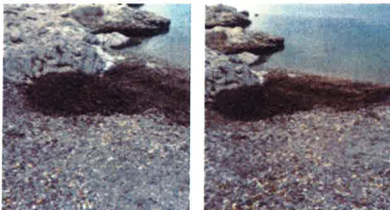
Slike 13. i 14. Sanacija plaže (uklanjanje kontaminiranog šljunka)

Nakon zadnje provedene sanacije, kod preostalih monitoringa nije utvrđena prisutnost onečišćenja na predmetnoj lokaciji na površini plaže, tj. na šljunku.