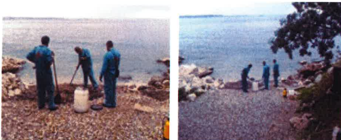
Slike 9. i 10. Mehaničko čišćenje (uklanjanje) šljunka kontaminiranog ugljikovodicima

Na poziciju zagađenja su se dopremila sva sredstva, oprema, uređaji i ljudstvo koji su se mogli koristiti na sanaciji. Angažiran je ADR kamion sa dizalicom, dostavno vozilo za prijevoz opreme i uređaja (pumpe, agregat, spremnici za zauljeni otpad - metalne bačve) kao i sredstva za upijanje ugljikovodika - apsorbens brane, apsorbens krpe.