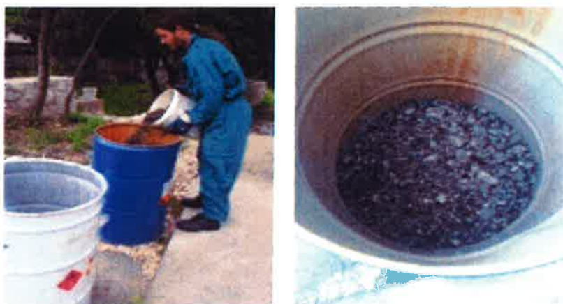
Slike 15. i 16. Deponiranje prikupljenog šljunka u metalnu ambalažu (bačve)