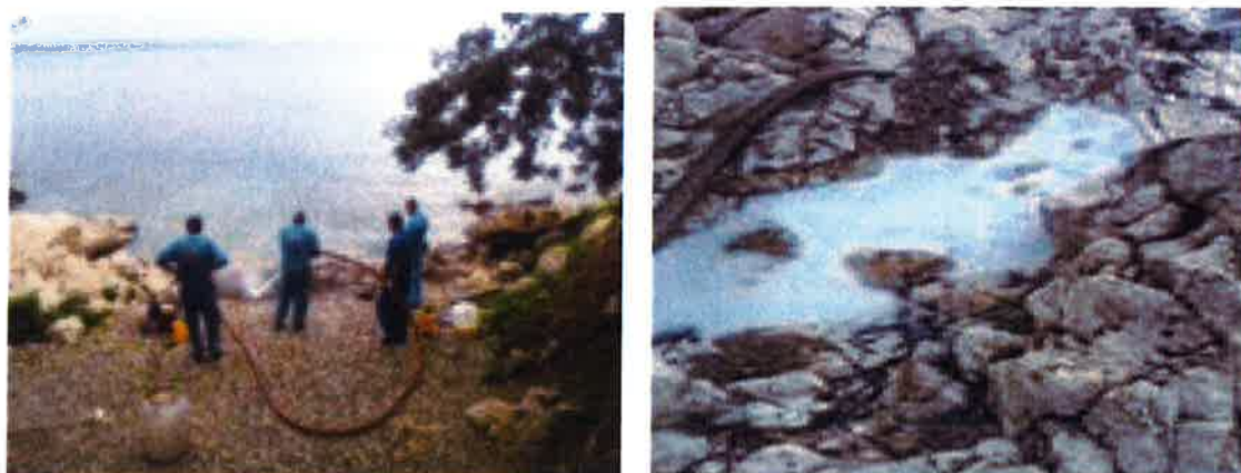
Slike 11. i 12. Pranje i ispiranje obalnog ruba i okolnog kamenja

U prvoj fazi sanacije mehanički se uklanjao kontaminirani šljunak te se deponirao u metalne bačve. Prvog dana je uklonjeno 950 kg kontaminiranog šljunka