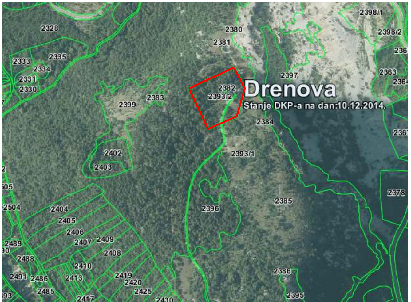
Slika 2. Ortofoto snimak lokacije s ucrtanom katastarskom podlogom