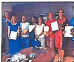
Sudionici 4. međunarodne kolonije umjetničke keramike

natjecateljskog karaktera, na kojoj sudjeluju mladi sopci i kanturi do 22 godine starosti. I ovogodišnja 38. manifestacija Mantinjada pul Ronjgi tradicionalno je kod Matetićeve rodne kuće okupila sopce i kanture iz Istre i Hrvatskog primorja.