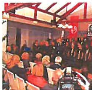
Završna Večer pul Matetićevega ognjišća