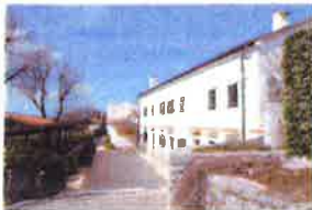
Spomen dom I. M. Ronjgova