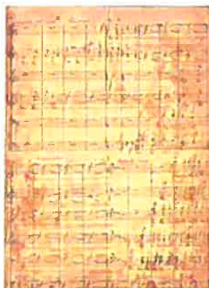
Autograf Ivana Matetića Ronjgova