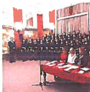
Predstavljanje notnog izdanja: MBR Mažurano moja