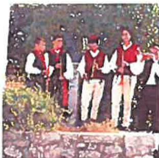
Mantinjada pul Ronjgi