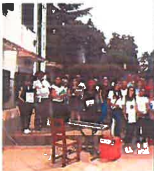
41. Proljeće u Ronjgima