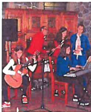
41. Proljeće u Ronjglima Radionica glagoljice