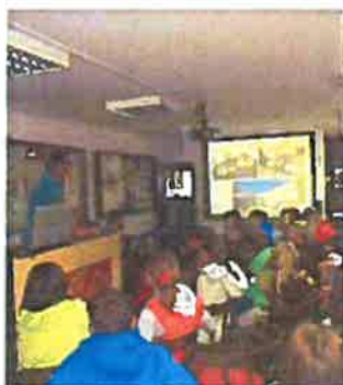
Posjeti Spomen domu

Realizacijom programa zacrtanih u 2019. godini povećano je javno djelovanje Ustanove, proširena ponuda prema korisnicima te je vidljivija prezentacija i intenzivnija medijska popraćenost.