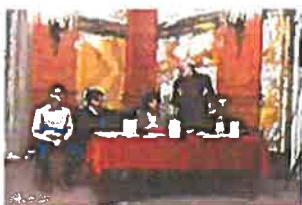
Promocija knjige Dih

(melografski zapisi i skladbe) koja sadrži 1024 arhivske rukopisne jedinice. Za sve u rukopisne jedinice ručno ispunjeni tipizirani arhivski obrasci. Izuzev ispunjavanja tipiziranih arhivskih obrazaca, rukopisna notna građa iz Matetićeve ostavštine katalogizirana je i u računalnom programu ISJS.