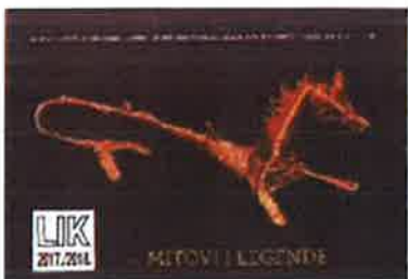
Slika 20. - LIK 2017./2018., plakat