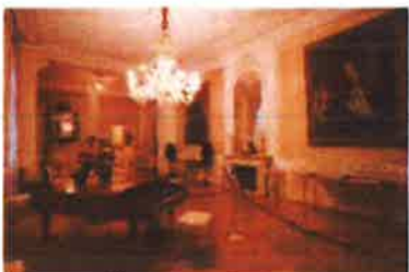
Slika 3.- Bijeli salon