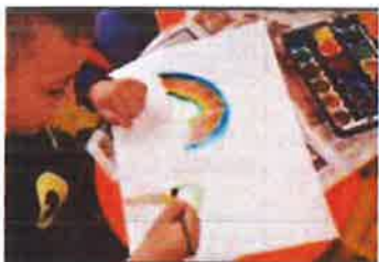
Slika 43. - Jutro u Muzeju, 2019.

Program je dio pedagoške djelatnosti Muzeja čija je specifičnost održavanje edukativno-kreativnih radionica, povezanih sa sadržajem i fondusom Muzeja, kao i segmentima lokalne