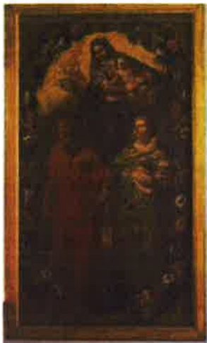
Slika 13. - Bogorodica s Djetetom, Marijom Magdalenom i Sv. Jeronimom, PPMHP 107356, nepoznati autor, 18.st.