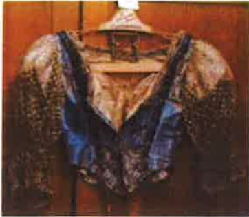
Slika 10. - Jakna Ane Zmajić signatura PPMHP KPO-ZUO 14395/1, nepoznati autor, 19. st.