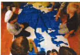
Slika 42. - Dani otvorenih vrata Čudotvornice, 2019.