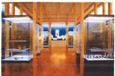
Slika 37. - Stalni postav Tragovi vremena - prapovijest i antika

unapređenje rada Muzeja kroz sudjelovanje djelatnika na radionicama, treninzima, konferencijama na kojima se potiče dijeljenje iskustava i upoznavanje s primjerima dobre prakse na polju interpretacije baštine i na polju razvoja publike. Članstvo također omogućava djelatnicima Muzeja promociju Muzeja na međunarodnoj razini kao i sudjelovanje u radnim tijelima koja se bave određenim temama.