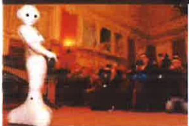
Slika 19. - Noć muzeja, 2019.