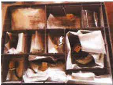
Slika 17. - Preventivna zaštita muzejske građe, pohranjeni nalazi s lokaliteta Grobišće

Brodске zastave dosad nisu bile izlagane radi lošeg stanja, a njihovo predstavljanje javnosti u sklopu novog stalnog postava nakon restauracije pridonijet će boljem razumijevanju lokalnih identiteta.