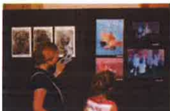
Slika 45. - Izložba radova Muzejskog malog ateljea, 2019.