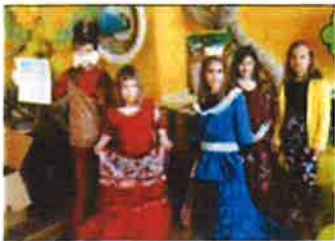
Slika 44. - Praznici u Muzeju, 2019.