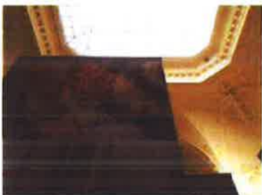
Slika 28. - Izložba povodom proslave 70. godine djelovanja Ansambla narodnih plesova i pjesama Hrvatske LADO u Muzeju, 2019.