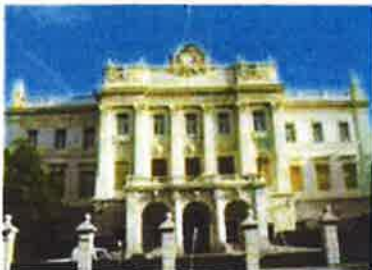
Slika 1. – Sjedište Pomorskog i povijesnog muzeja Hrvatskog primorja Rijeka u Guvernerovoj palači, Trg Riccarda Zanelle 1, Rijeka