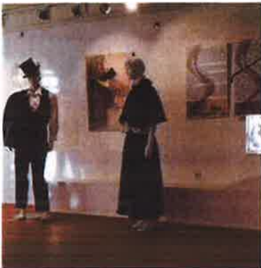
Slika 33. - Gostovanje izložbe Rigojančji-ljubav kao slatko nadahnuće u Mađarskom kulturnom institutu u Zagrebu, 2019.