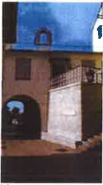
Slika 5. Muzejska zbirka Kastavštine, Prolaz Ivana iz Kastva 1, Kastav