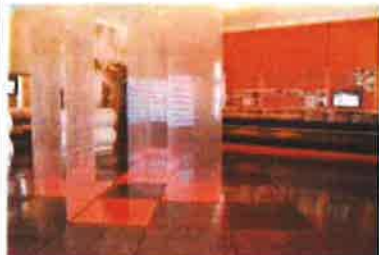
Slika 36. - Stalni postav U obrani domovine