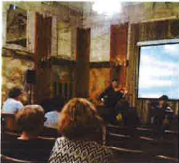
Slika 53. - partnerima na projektu E-VOKED (Erasmus+) predstavili smo suradnju Muzeja s Glazbenom školom Ivan Matetić Ronjgov

Ciljne skupine ovog projekta su zaposlenici muzeja koji rade s odraslom i tinejdžerskom skupinom posjetitelja, učitelji strukovnih škola te učenici srednjih strukovnih škola i studenti. Očekivani rezultati projekta su: