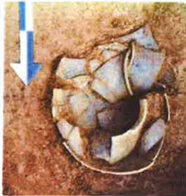
Slika 8. - Keramička posuda in situ pronađena 2019. na lokalitetu Grobišće, PPMHP 127767