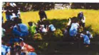
Slika 40. - Čudotvornica na putu, 2019.

Sve edukativno-kreativne radionice povezane su sa sadržajem Muzeja te prilagođene dobi polaznika. U skladu su s Nacionalnim okvirnim kurikulumom za predškolski odgoj i obrazovanje te opće obvezno i srednjoškolsko obrazovanje te koreliraju s Nastavnim planom i programom za osnovnu školu te Nastavnim planovima i programima za gimnazije i strukovne škole.