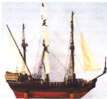
Slika 47. - Jedrenjak Pomorske škole Piran iz Zbirke maketa brodova Brodogradilišta Kraljevica

Koordinator programa: imenovani tim Muzeja