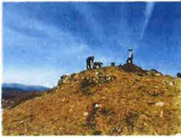
Slika 32. - Arheološka istraživanja lokaliteta Fortica, Mrkopalj u suradnji s udrugom Processus Moitanus, 2019.