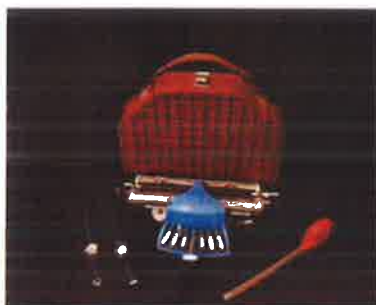
Slika 38. - Dio darovane građe Udruge slijepih Primorsko-goranske županije

Interaktivni vodič za djecu Tia putuje kroz 120 godina Guvernerove palače u svom je tiskanom izdanju objavljen 2016. godine uz projekt obilježavanja 120. obljetnice izgradnje palače. Nakon tiskanog izdanja Muzej je tijekom 2019. godine učinio iskorak u prezentaciji i interpretaciji prostora nekadašnje guvernerove rezidencije i predstavio audio vodič na hrvatskom i engleskom jeziku. Tijekom 2020. godine Muzej planira povećati broj audio vodiča kako bi se ovaj vrijedan način proširenja mogućnosti prezentacije ponudio što većem broju korisnika. Planirani izvori financiranja: Primorsko-goranska županija, vlastita sredstva.