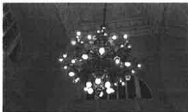
Slika 48. - Detalj interijera Mramorne dvorane