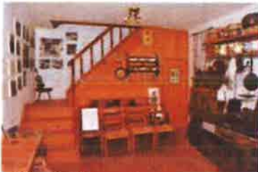
Slika 6. Etnografska zbirka otoka Krka u Dobrinju, Dobrinj 106, Dobrinj