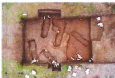
Slika 7. Grobnik - Grobišće, istraživanje lokaliteta, 2019.

Terenskim se istraživanjem, osim muzejske građe prikuplja i dokumentacija potrebna za izučavanje i kontekstualizaciju arheološke, pomorsko-povijesne, etnološke i kulturno-povijesne baštine. Nastavlja se suradnja Muzeja s općinama, udrugama i srodnim ustanovama na sustavnim arheološkim i drugim istraživanjima. Za 2020. planirana su sljedeća istraživanja: