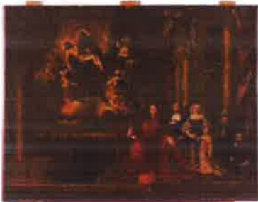
Slika 14.. - Obitelj Barbadicus i Pieta, PPMHP 107402, nepoznati autor, 17. st.