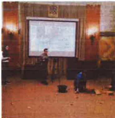
Slika 46. - Dramci iz Guvera tijekom predstave u Noći muzeja 2019.

kulturno-povijesne baštine kraja u kojemu Čudotvornica na putu gostuje izvan prostora Muzeja. Svojom radionicama Čudotvornica je do sada prodonijela obilježavanju raznih manifestacija poput Kreativne šetnice u Kostreni 2016., Kostrenskog SOLsticija 2016., Adventa u Cresu 2016., Antičkih dana u Omišlju 2017. i 2018., DŽEP-a, dječjeg festivala malih i minijturnih scena Teatra OZ, u Brseču 2017. i 2018.