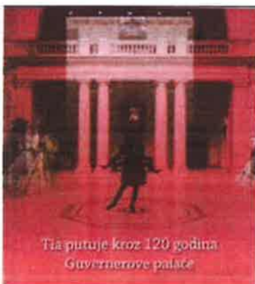
Slika 39. - Naslovnica tiskanog izdanja Tia putuje kroz 120 godina Guvernerove palače