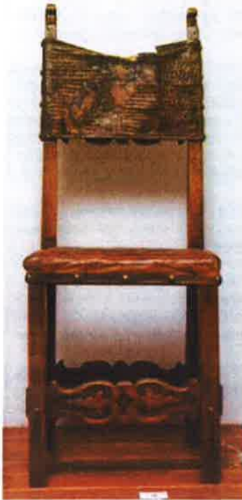
Slika 16. - stolac s kožnom presvlakom PPMHP KPO-ZUO 198/1 prva polovica 17. stoljeća