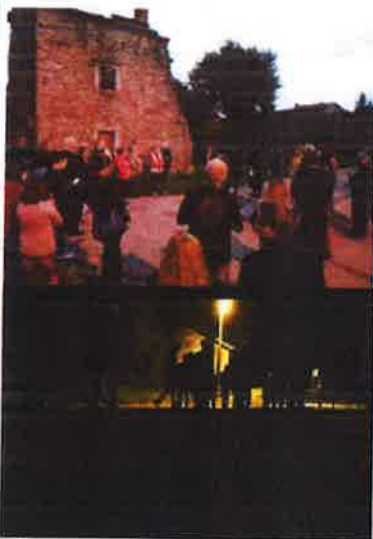
Slike 26. - Prepoznavanje odsustva Memorijalni centar Lipa pamti, 2019.

Izložba će se baviti interkulturalnošću kao jednom od osnovnih odrednica glazbene umjetnosti, humanošću kroz pristup medicini, režimima koji su obilježili prvu polovicu 20. stoljeća u Rijeci i ljudima koji su se našli u tom vrlogu. Izložba se realizira u suradnji s Muzejem violine iz Cremona čija će građa biti izložena, osobito ona koja je usko povezana s Kresnikovim radom - violine Antonia Stradivarija, Guarnerija del Gesu, Carla Schiavija i Pietra Tatara. Planirani izvori financiranja: Veleposlanstvo Republike Italije, RIJEKA 2020, Grad Rijeka, Primorsko-goranska županija, vlastita sredstva.