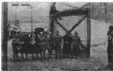
Slika 23. - Sušak - Granica, razglednica, Sušak 1931. godina, PPMHP 123689