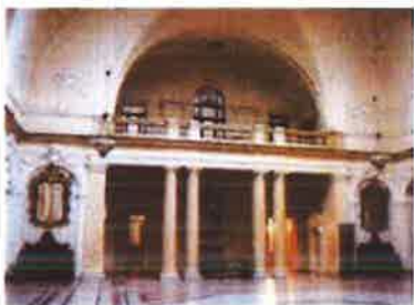
Slika 2.- Veliki Atrij