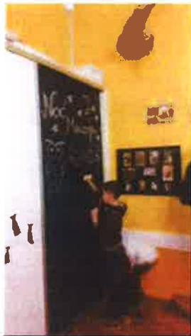
Slika 41. - Noć muzeja u Čudotvornici, 2019.