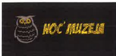
Slika 18. - Noć muzeja, logo