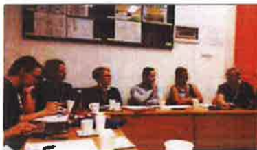
Slika 52. - partnerski sastanak na projektu E-VOKED (Erasmus+) u Muzeju, listopad 2019.

Cilj ovog projekta je razmjena iskustava i razvoj zajedničkih primjera dobre prakse u muzejima za rad s posebnim obrazovnim skupinama - učenicima strukovnih škola i studentima određenih struka vezanih za trgovinu, turizam, pomorstvo, tekstil ili ugostiteljstvo.