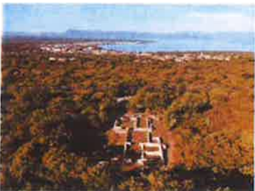
Slika 9. Cickini, snimak arheološkog lokaliteta dronom, 2019.