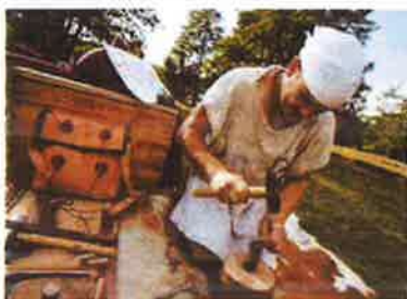
Slika 49. - Rimska noć na Claustri u sklopu projekta Claustra+, kolovoz 2019.