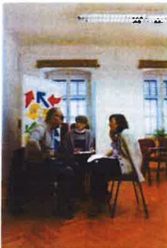
Slika 51. - Muzej budućnosti - radionice s partnerima na projektu