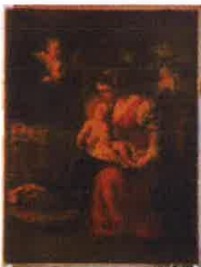
Slika 15. - Bogorodica s Djetetom, PPMHP 123682, nepoznati autor, 18 st.

Po završetku konzervatorsko-restauratorskih radova, odjeća će se izložiti u stalnom postavu u adekvatnim vitrinama i u skladu s preporukama HRZ-a. Vitrine je potrebno nabaviti do završetka restauratorskih radova.