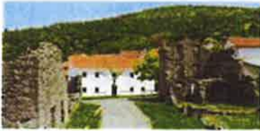
Slika 4. Muzejska zbirka Lipa, smještena u Memorijalnom centru Lipa pamti, Lipa 35, Šapjane