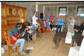
Mantinjada pul Ronjgi