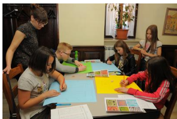
Rad djece u radionicama