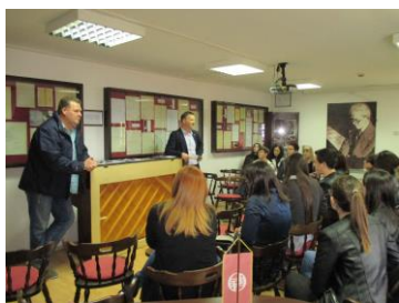
Posjet učenika glazbene škole iz Rijeke