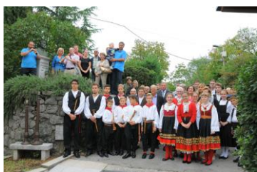
Sudionici Mantinjade pul Ronjgi