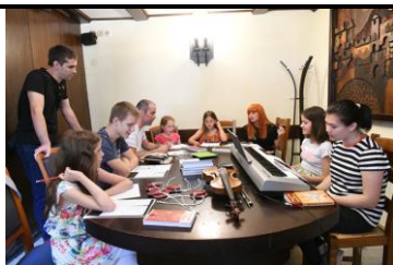
Radionica mladih skladatelja