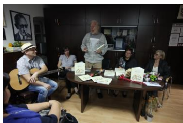
Katedra čakavskih pjesnika