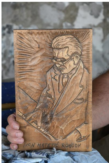
Rad delavske katedre